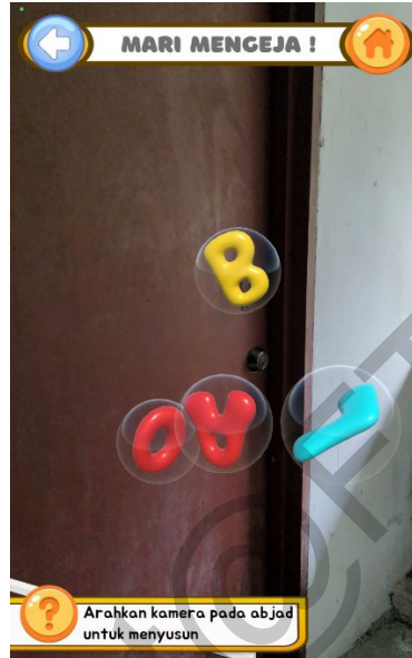
Rajah 3 Antara Muka Mari Mengeja

“L” dan “A” berbentuk 3D juga dipaparkan secara rawak di ruangan Augmentasi Realiti. Pengguna perlu membawa kamera kepada abjad-abjad tersebut dan disusun pada tempat jawapan yang disediakan bagi membentuk satu perkataan. Butang “Anak Panah” berfungsi untuk kembali ke halaman sebelum dan butang “Rumah” berfungsi untuk kembali ke halaman utama