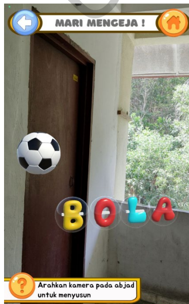
Rajah 4 Antara Muka Mari Mengeja Setelah Selesai

Rajah 4 mempamerkan objek 3D berbentuk bola dan huruf-huruf "B", "O", "L", dan "A" yang telah disusun dan diselesaikan untuk membentuk perkataan "BOLA". Ini menunjukkan cara aplikasi membantu kanak-kanak belajar mengeja dengan memvisualisasikan objek sebenar yang diwakili oleh perkataan tersebut.