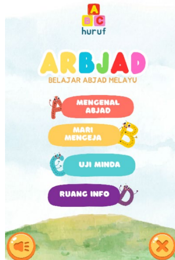
Rajah 1 Antara Muka Halaman Utama