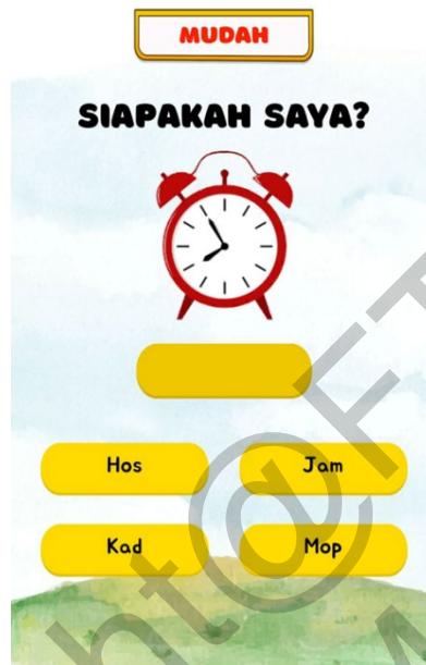
Rajah 5 Antara Muka Modul Kuiz

Rajah 5 mempamerkan antara muka Modul Kuiz. Antara muka modul ini memaparkan teks soalan, paparan objek 2D, tempat jawapan dan pilihan jawapan. Setiap soalan mempunyai paparan objek 2D dan pilihan jawapan yang berlainan. Untuk menjawab soalan, pengguna perlu menggerakkan pilihan jawapan atau 'Drag' ke tempat jawapan. Setiap jawapan yang dipilih mempunyai suara atau audio tersendiri sama ada jawapan betul atau jawapan salah.