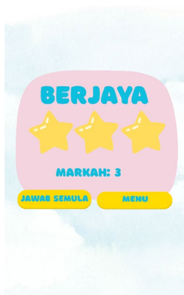
Rajah 6 Antara Muka Paparan Markah

Rajah 6 menunjukkan antara muka Paparan Markah setelah setiap soalan kuiz telah habis dijawab. Paparan bintang dan skor akan mengikut seberapa banyak soalan yang dapat dijawab dengan betul mahupun salah. Butang 'Jawab Semula' juga dipaparkan untuk pengguna menjawab semula soalan kuiz dan butang 'Menu' akan membawa pengguna ke menu hadapan.