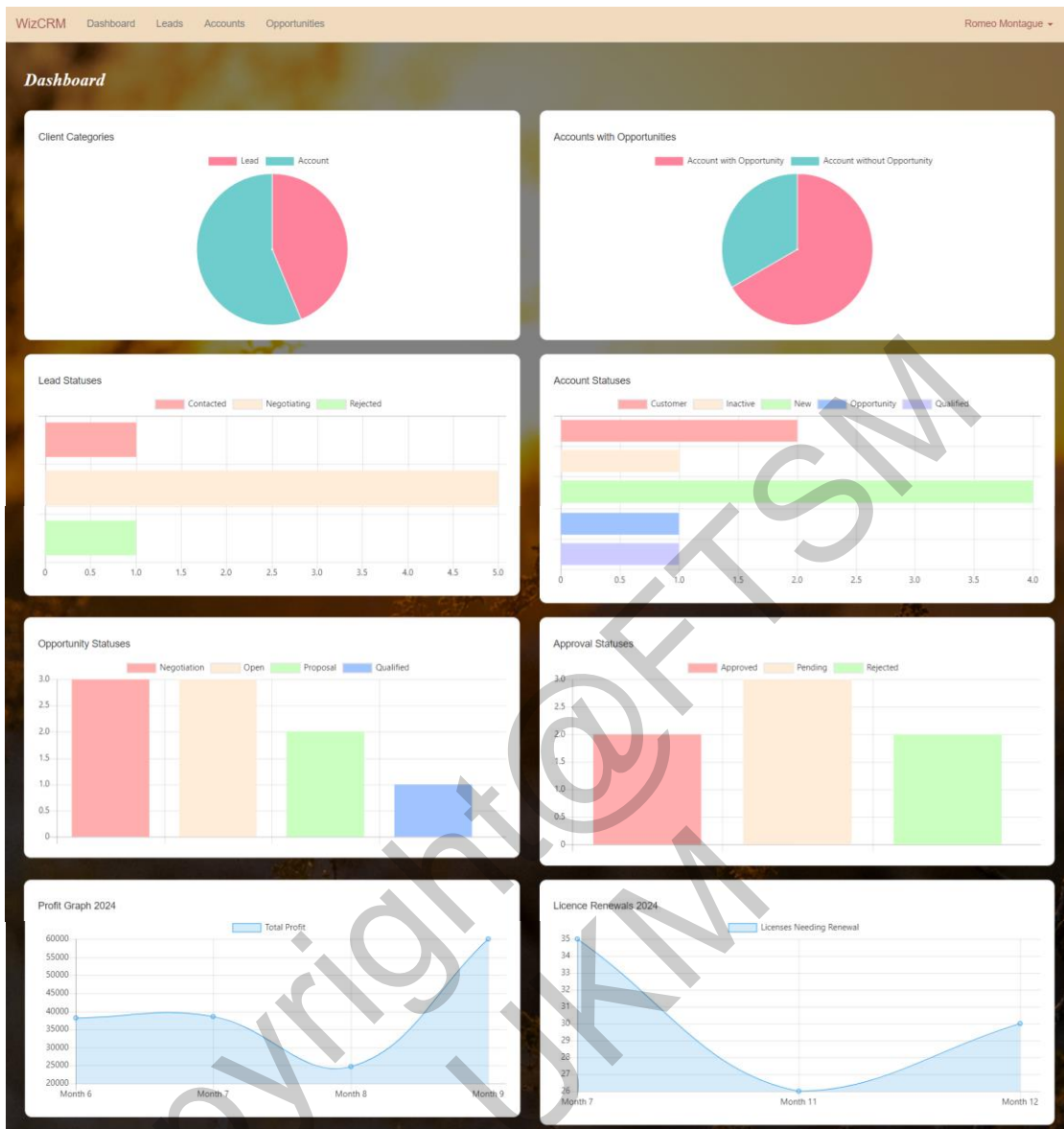
Rajah 6 Antara Muka Papan Pemuka

Papan pemuka WizCRM di Rajah 6 memberikan paparan grafik dan carta yang teratur, menawarkan laporan dalam kedalaman perniagaan. Kawasan kandungan utama membezakan kategori pelanggan dalam carta pai, menunjukkan peratusan jelas. Carta lain mengekalkan pengedaran akaun berdasarkan penglibatan dengan peluang, sementara carta bar menunjukkan status plumbum dan akaun. Grafik garis menggambarkan trend kewangan, seperti pendapatan bulanan dan tamat tempoh lesen. Antara muka ini memperkaya pengguna dengan data yang kaya untuk keputusan strategik dalam pengurusan pelanggan.