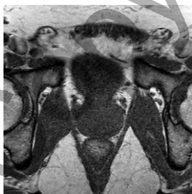
(a) imej prostat normal T1

Perbezaan diantara imej T1 dengan T2 ialah imej T1 membantu menentukan bentuk prostat iaitu berbentuk seperti walnut dan persempadanan prostat dengan organ lain di sekelilingnya, manakala imej T2 dapat menyediakan resolusi imej yang jelas untuk menentukan anatomi prostat yang terbahagi kepada dua iaitu pada sebelah atas dinamakan zon peralihan dan pada belah bawah dinamakan sebagai zon peripheral serta boleh digunakan untuk mengesan ketaknormalan pada prostat. Ini bermakna, terdapat ketumbuhan atau ketulan pada bahagian itu (Kinkel 2014). Perbezaan T1 dan T2 boleh dilihat dalam Rajah 1(a) dan 1(b) dibawah dimana persempadanan organ prostat boleh dilihat dengan jelas dalam Rajah 1(b) berbanding Rajah 1(a).