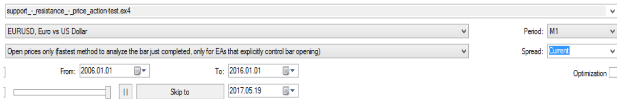
Rajah 5 Pengujian strategi menggunakan matawang EURUSD dan tempoh masa M1

Rajah 4 dan rajah 5 menunjukkan carta yang tidak melakukan sebarang transaksi dengan menggunakan tempoh masa M1.