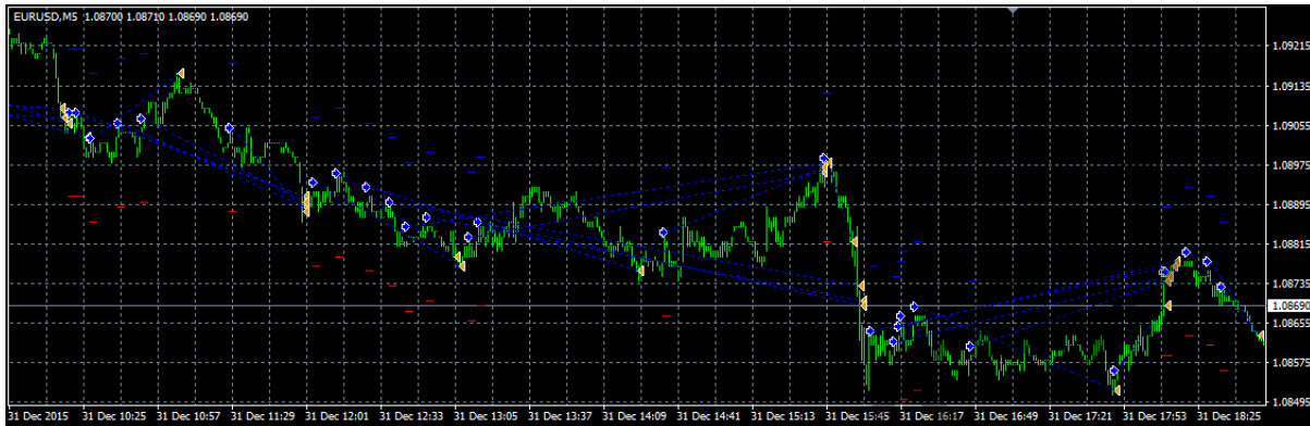
Rajah 2 Carta yang dipaparkan dalam MetaTrader 4

Secara umum, pergerakan carta dan transaksi aktiviti jual beli berkait rapat dengan aturcara yang diubah. Untuk menjalankan transaksi, satu langkah penting diambil. Langkah itu adalah memastikan kedudukan penjualan dan pembelian di dalam aturcara. Kedudukan aturcara yang betul akan menjalankan transaksi aktiviti jual beli.