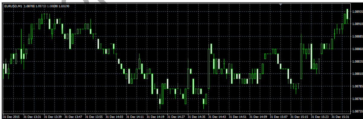
Rajah 4 Carta yang tidak melakukan transaksi jual beli

Rajah 2 dan rajah 3 menunjukkan carta yang melakukan transaksi aktiviti jual beli menggunakan matawang EURUSD dan tempoh masa M5.