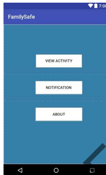
Rajah 1 Antaramuka menu utama

Operasi pemantauan dan pengawalan penggunaan Internet anak-anak ditunjukkan dalam Rajah 2. Memasti aplikasi ini berjalan di dalam Android adalah rumit.