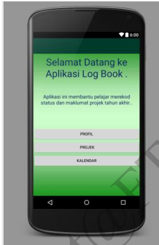
Rajah 4: Antara muka untuk modul pelajar