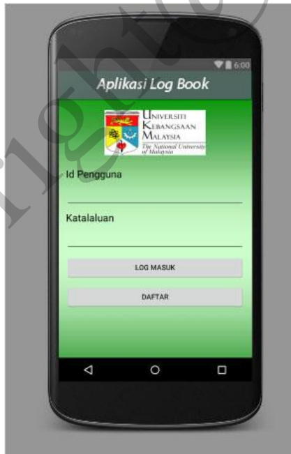
Rajah 3: Antara muka untuk log masuk