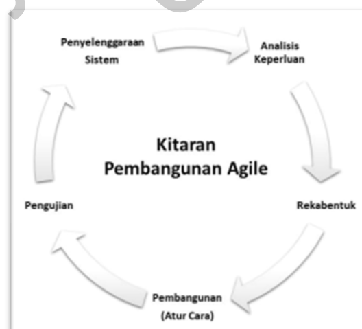
Rajah 1 Kitaran Metodogi Agile

Metodologi yang digunakan dalam membangunkan sistem ini adalah model Agile. Metodologi ini dipilih kerana kaedah ini menjangkakan perubahan dan lebih fleksibel berbanding kaedah tradisional. Perubahan kecil boleh dibuat tanpa perlu membelanjakan kos yang tinggi atau melakukan pemindaan jadual (Fowler & Highsmith 2001). Model Agile mengutamakan penglibatan pelanggan dalam membangunkan sistem ini sejak dari awal proses pembangunan. Objektif utama kaedah ini adalah untuk memastikan pelanggan terlibat secara langsung dalam setiap fasa pembangunan agar mereka berpuas hati dengan produk akhir projek ini. Sistem ini juga perlu dibangunkan dalam masa yang singkat, jadi model Agile amat bersesuaian dalam proses pembangunan sistem ini. Rajah 1 menunjukkan kitaran pembagunan Agile yang digunakan dalam sistem ini.