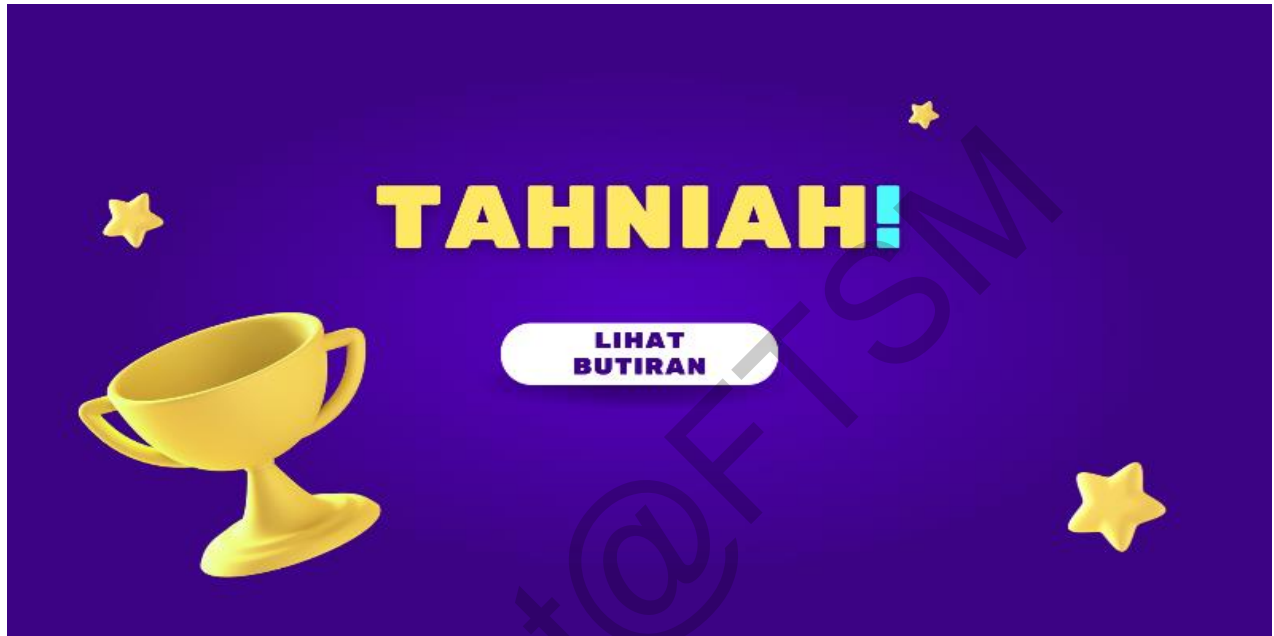
Rajah 10 Antara Muka Skrin Tahniah

Rajah 10 dan Rajah 11 menunjukkan paparan skrin “tahniah” dan butiran situasi yang telah dimainkan oleh pengguna. Pengguna boleh menekan butang “Main Semula” untuk memulakan permainan baru dan “Keluar” untuk keluar dari permainan.