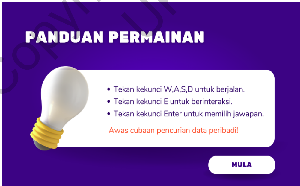
Rajah 3 Antara muka panduan permainan

Rajah 3 menunjukkan antara muka panduan permainan apabila butang “Mula Permainan” ditekan.