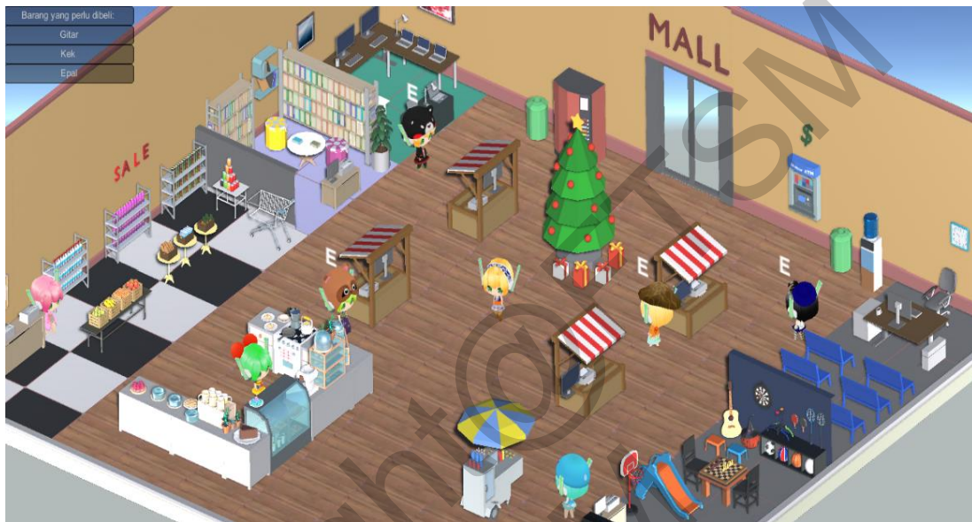
Rajah 6 Antara muka permainan utama

Rajah 6 menunjukkan antara muka permainan utama yang memaparkan suasana sebuah pusat membeli-belah dalam pandangan isometrik dan pengguna boleh mengawal and menggerakkan watak utama permainan ini. Pemain boleh meneroka tempat ini dengan menggunakan kekunci W,A,S,D.