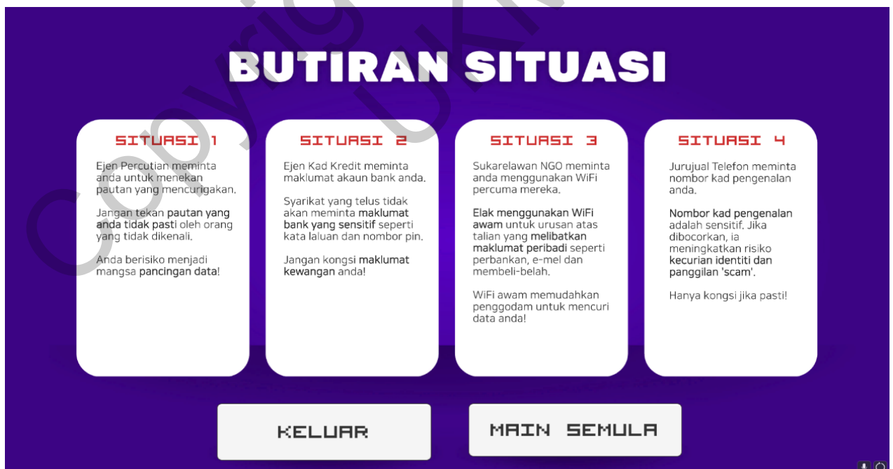
Rajah 11 Antara Muka Butiran Situasi