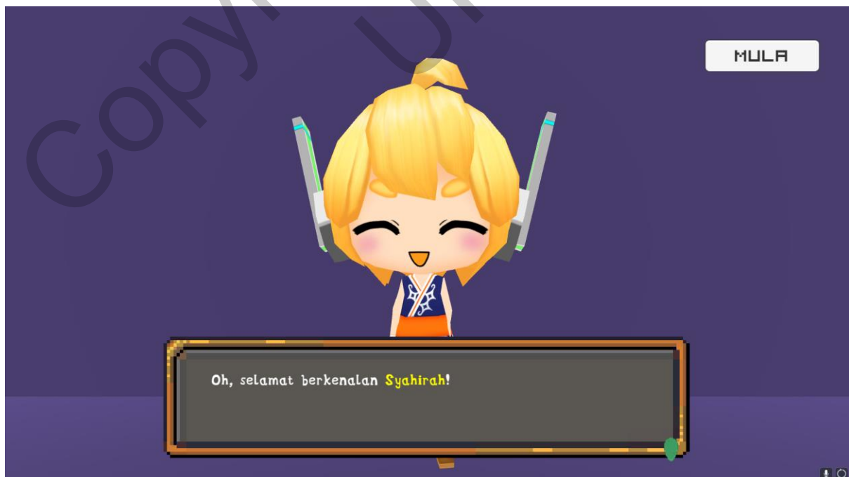
Rajah 5 Antara muka dialog pengenalan