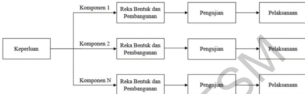
Rajah 1 Model Incremental

dan pembangunan, fasa pengujian dan fasa pelaksanaan. Rajah 1 di bawah menunjukkan Model Incremental.