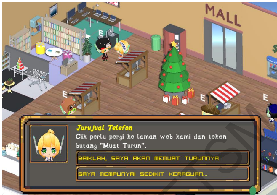
Rajah 7 Antara muka dialog NPC

Rajah 8 berikut merupakan skrip TestMessage_Selection.cs yang berfungsi untuk memaparkan dialog Non-Player Character (NPC) yang ada di dalam permainan. Skrip ini juga membenarkan pemain untuk memilih pilihan jawapan dan menentukan dialog yang akan dipaparkan seterusnya menggunakan kaedah else if . Rajah 9 menunjukkan peralihan antara animasi untuk Third-Person Controller pada bahagian Animator dalam Unity. Animator mengawal peralihan jenis-jenis animasi yang ada pada watak utama permainan ini.