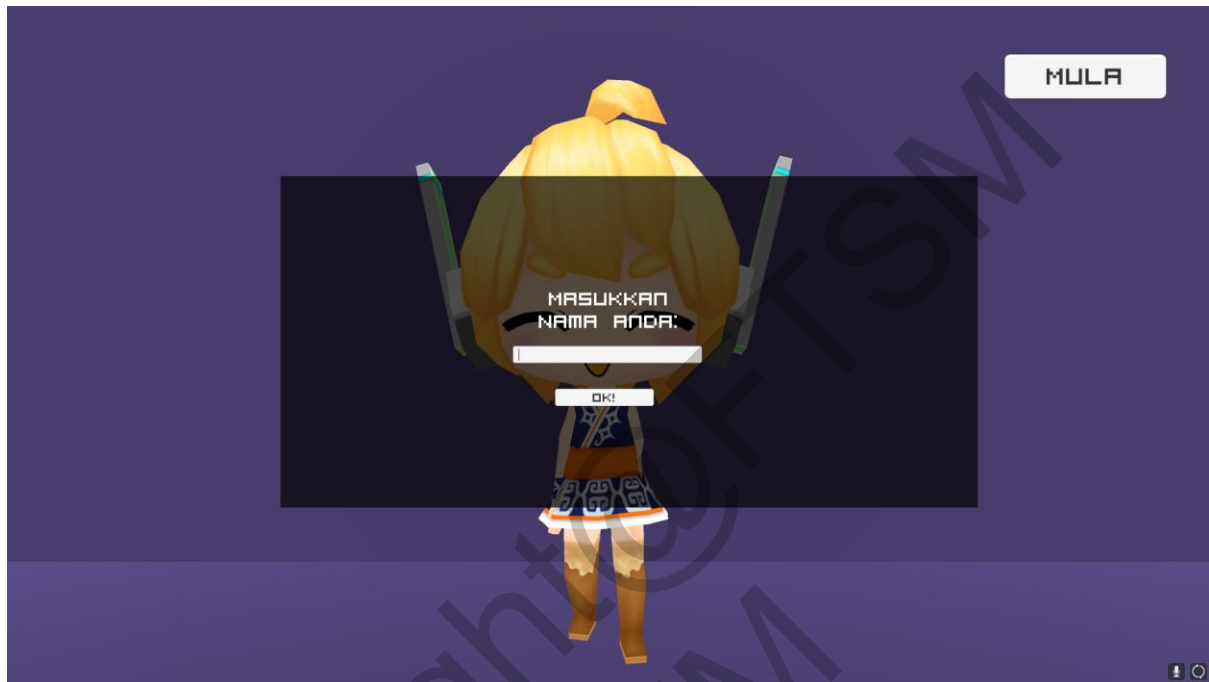
Rajah 4 Antara muka pendaftaran nama

Setelah membaca panduan, permainan akan memaparkan dialog pengenalan dan pengguna diminta untuk memasukkan nama. Nama tersebut akan didaftarkan dalam permainan. Pengguna perlu menekan butang “Mula” untuk teruskan permainan. Rajah 4 dan Rajah 5 menunjukkan antara muka pendaftaran nama dan dialog pengenalan.