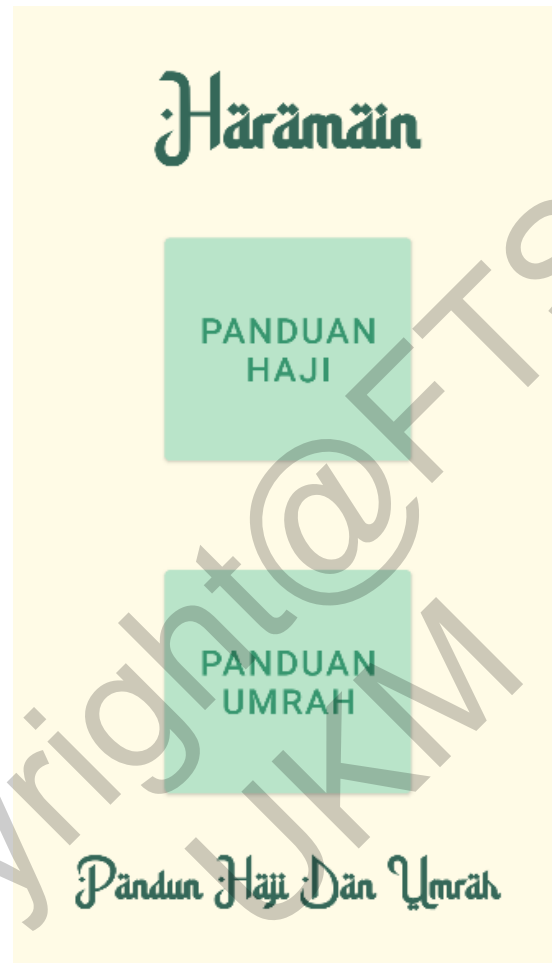
Rajah 4 Antara Muka Panduan Haji Dan Umrah

Rajah 4 merupakan antara muka untuk pengguna melihat panduan haji atau umrah. Pengguna boleh menekan butang Haji atau Umrah dan sistem akan memaparkan panduan dengan lengkap.