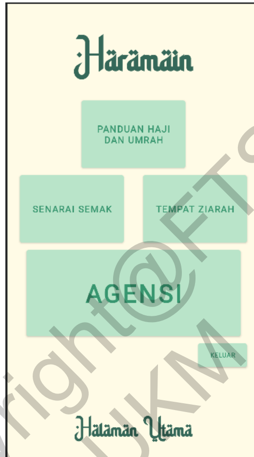
Rajah 2 Antara Muka Utama Haramain

Rajah 2 merupakan antara muka halaman utama bagi aplikasi Haramain. Pengguna boleh menekan butang yang terdapat pada halaman utama untuk menggunakan aplikasi ini.