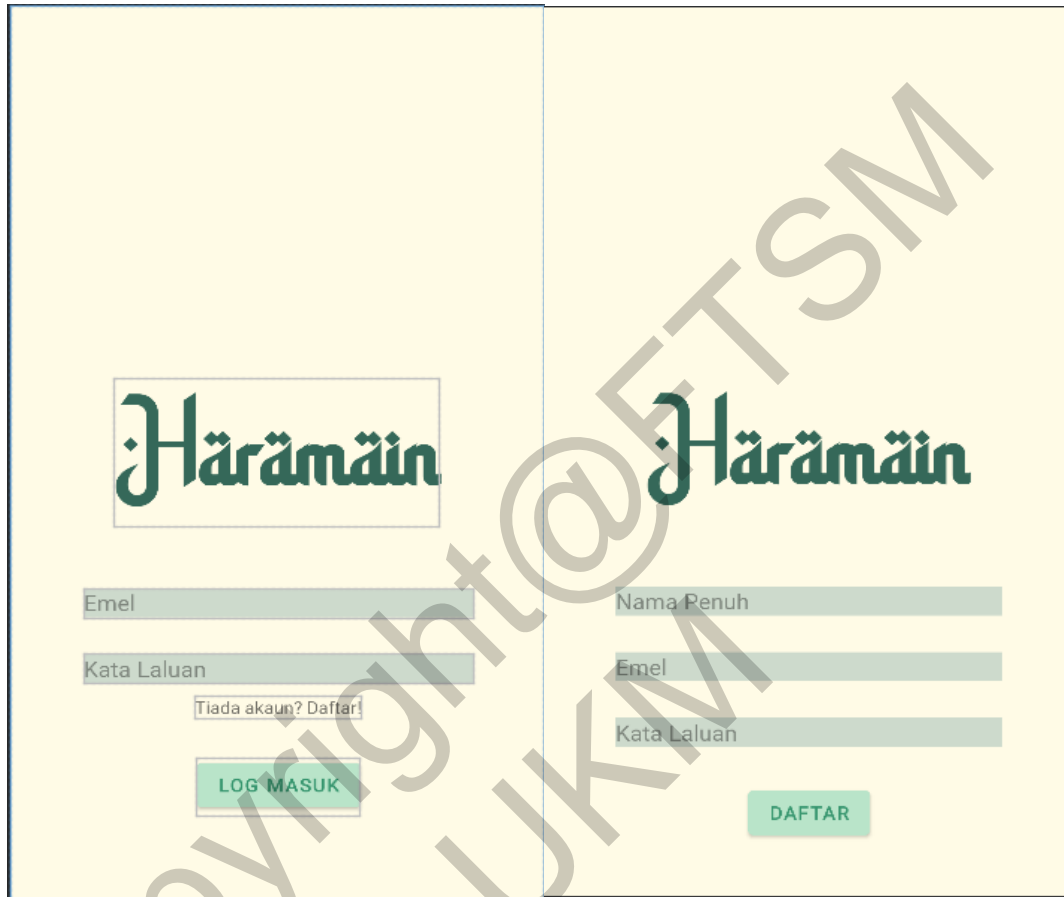
Rajah 1 Antara Muka Log Masuk Dan daftar Akaun

Rajah 1 merupakan antara muka bagi daftar akaun dan antara muka bagi log masuk pengguna aplikasi Haramain. Pengguna perlu mengisi butiran yang telah ditetapkan untuk masuk ke dalam aplikasi Haramain.