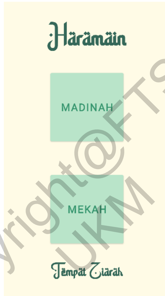
Rajah 6 Antara Muka Tempat Ziarah

Rajah 6 merupakan antara muka tempat ziarah yang akan memberikan rekomendasi tempat ziarah kepada pengguna sama ada di Mekah atau Madinah. Pengguna boleh menekan butang yang ingin dilihat dan sistem akan memaparkan tempat ziarah beserta sejarah mereka.