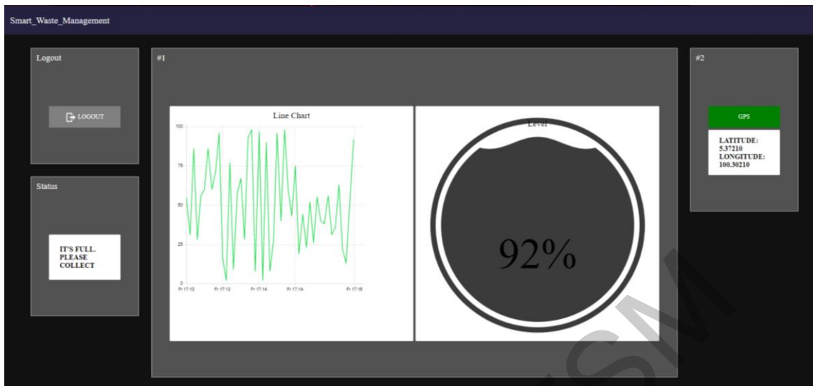
Gambar rajah 1.5 Antaramuka Pengguna

Antara muka ini adalah contoh antara muka data. Data GPS masih belum dikonfigurasi dan ditunjukkan di sini. Kepenuhan data tong sampah ditunjukkan dalam pelbagai bentuk pembentangan untuk tarikan visual, tetapi semuanya menunjukkan data yang sama. Antara muka ini mempunyai butang log keluar sendiri untuk log keluar ke halaman log masuk dan paparan status yang memberitahu melalui mesej.