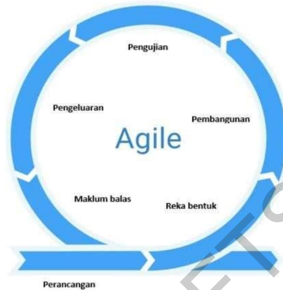
Rajah 1 Metodologi Agile