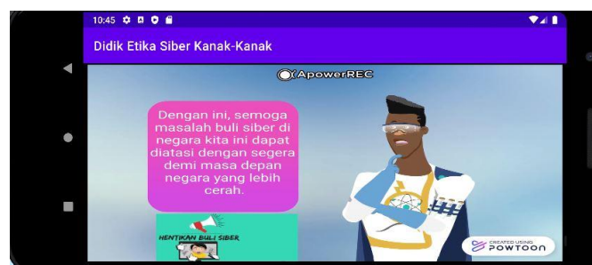
Rajah 6 Antara muka pemain video

Dalam bahagian halaman definisi, definisi tentang buli siber dan perkara-perkara yang perlu dibuat sekiranya pengguna mengalami buli siber. Terdapat sebuah butang yang bernama 'VIDEO' di bahagian atas halaman ini yang akan tayangkan sebuah video tentang definisi buli siber dalam bentuk animasi jika ditekan. Talian perkhidmatan rasmi juga disertakan dalam halaman ini bagi pengguna untuk menelefon dan meminta pertolongan jika situasi mereka amat teruk.