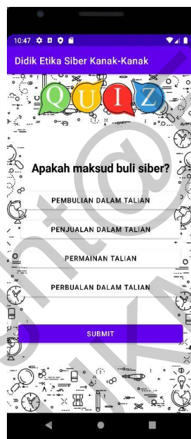
Rajah 7 Antara muka halaman kuiz

Ciri pemain video dalam aplikasi ini membolehkan pengguna untuk menonton video mengenai buli siber secara terus dalam persekitaran aplikasi. Fungsi ini bertujuan untuk menyediakan pengalaman menonton video yang lebih selesa dan terintegrasi kepada pengguna dalam satu aplikasi yang serba lengkap.