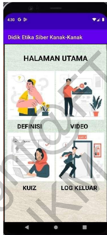
Rajah 4 Antara muka papan muka

Pengguna baharu perlu mendaftar akaun dengan melengkapkan butiran yang diminta iaitu alamat emel, dan kata laluan. Bagi pengguna yang telah mempunyai akaun, pengguna boleh log masuk dengan memasukkan alamat emel dan kata laluan yang telah didaftarkan.