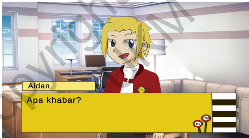
Rajah 5 Antara Muka Permainan Simulasi

Rajah 4 adalah antara muka simulasi pemain dimana pemain akan mengawal watak ke destinasi manakala rajah 5 menunjukkan rupa antara muka jalan cerita yang akan dimainkan sebelum permainan bermula. Nama watak dan dialog akan dimainkan dan pemain hanya harus klik kiri pada tetikus mereka untuk membaca keseluruhan cerita.