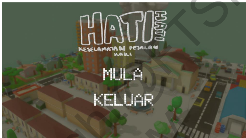
Rajah 2 Antara Muka Halaman Utama

Aset dan grafik yang telah dihasilkan akan dimuatkan ke dalam perisian Unity untuk membentuk antara muka permainan. Setelah antara muka permainan selesai dibuat, skrip tertentu ditulis menggunakan Visual Studio dengan menggunakan bahasa pengaturcaraan C#. Skrip-skrip tersebut kemudian dimasukkan ke dalam objek permainan dalam perisian Unity agar antara muka dan objek-objek tersebut dapat berfungsi.