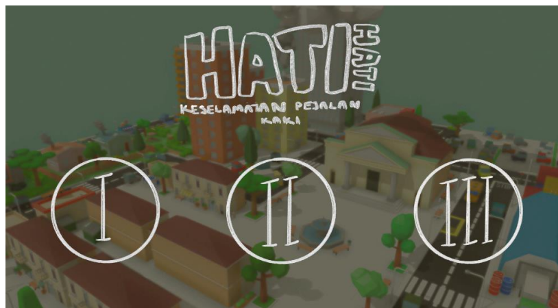
Rajah 3 Antara Muka Pemilihan Tahap

Rajah 2 menunjukkan antara muka halaman utama sistem ini dimana dua butang disediakan iaitu butang “Mula” dan butang “Keluar”. Rajah 3 menunjukkan antara muka pemilihan tahap permainan. Permainan mempunyai 3 tahap dan hanya akan dibuka selepas tahap sebelumnya diselesaikan. Dalam antara muka ini, ketiga-tiga tahap telah dibuka.