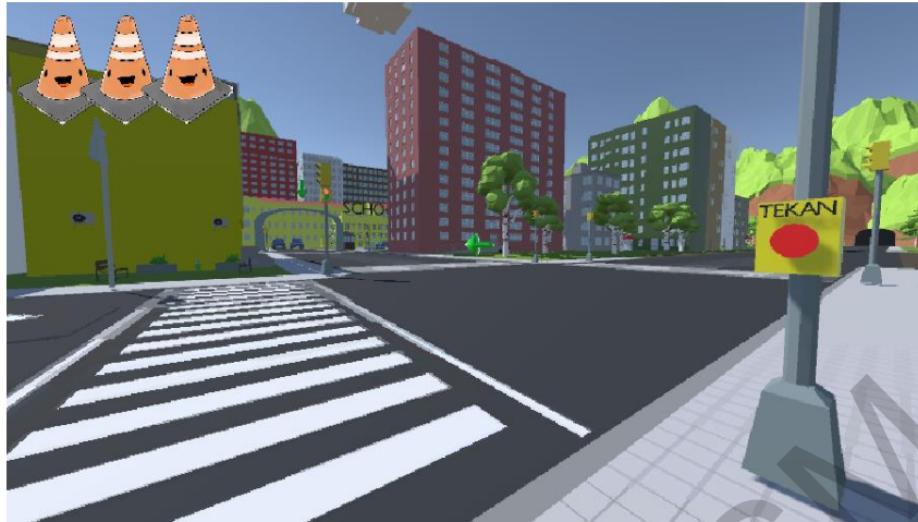
Rajah 4 Antara Muka Permainan Simulasi

Rajah 4 adalah antara muka simulasi pemain dimana pemain akan mengawal watak ke destinasi manakala rajah 5 menunjukkan rupa antara muka jalan cerita yang akan dimainkan sebelum permainan bermula. Nama watak dan dialog akan dimainkan dan pemain hanya harus klik kiri pada tetikus mereka untuk membaca keseluruhan cerita.