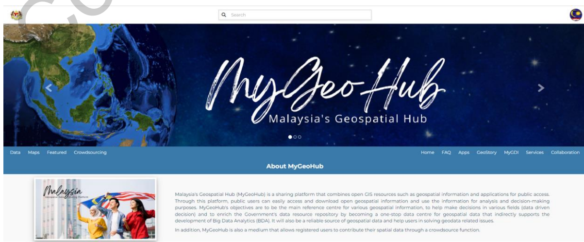
Rajah 3 Antara Muka Laman Utama

Sistem ini akan memaparkan laman utama apabila pengguna berjaya log masuk seperti yang ditunjukkan dalam Rajah 3. Hanya pengguna berdaftar boleh melihat dan menggunakan fungsi Crowdsourcing . Tab ' Crowdsourcing ' tidak kelihatan sekiranya pengguna tidak ' Sign in ' terlebih dahulu. Pengguna umum di benarkan untuk memuat turun dataset tetapi untuk membuat perubahan dan memuatnaik tidak dibenar sama sekali.