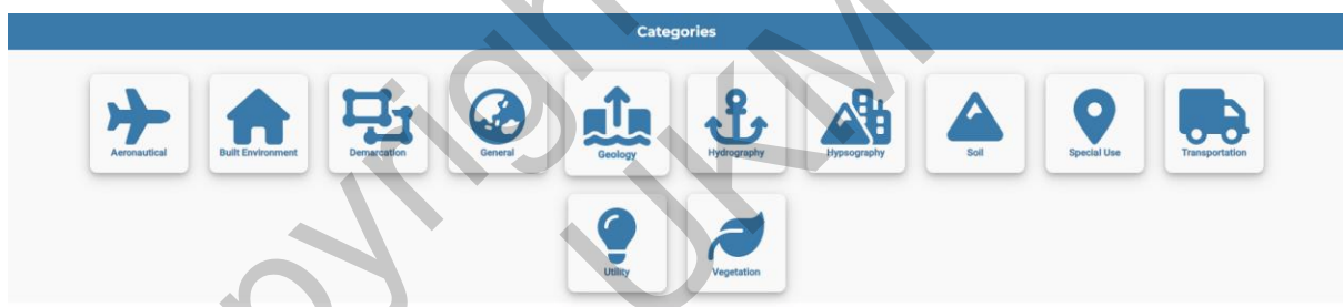
Rajah 5 12 Kategori Data