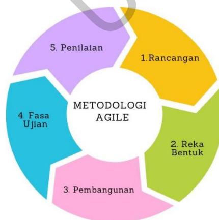
Rajah 1: Metodologi Agile

Metodologi yang digunakan dalam pembangunan projek ini ialah Agile yang menggunakan lelaran pembangunan dan pengujian berterusan sepanjang kitaran hayat pembangunan perisian projek. Metodologi ini dipilih kerana ia merangkumi proses dinamik yang membenarkan perubahan walaupun sudah jauh dalam kitaran hayat pembangunan. Metodologi ini adalah amat sesuai dengan projek ini yang memerlukan pendekatan pembangunan model HoVer-Net yang lebih fleksibel dan berorientasikan kepada pengguna. Dengan menggunakan metodologi Agile untuk projek ini, produk akhir yang berkualiti boleh dihasilkan.