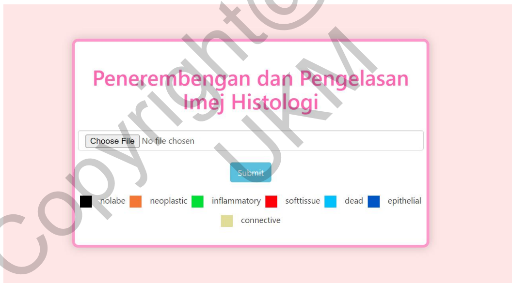
Rajah 2 Antara Muka Papan Pemuka

Seterusnya, apabila pengguna telah log masuk dengan mengisi nama pengguna dan kata laluan, mereka akan dibawa ke paparan papan pemuka untuk pengguna memuat naik gambar tisu histopatologi seperti yang ditunjukkan pada Rajah 2.