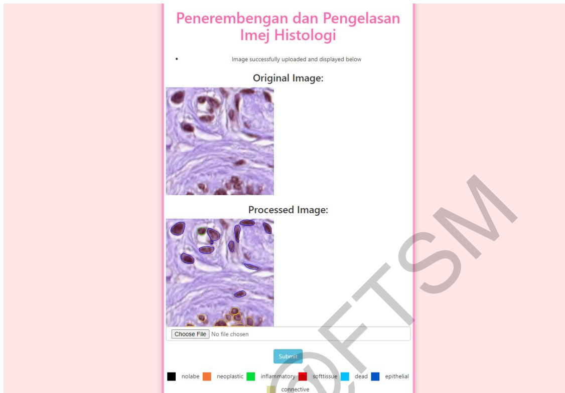
Rajah 3 Antara Muka Keputusan

Rajah 3 menunjukkan hasil keputusan imej tisu histopatologi yang telah melalui proses penerembengan dan pengelasan. Hasil penerembengan dan pengelasan ditetapkan mengikut warna dan kelas seperti yang ditunjukkan dalam rajah 3.