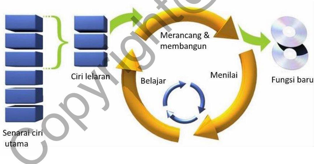
Rajah 1 Gambaran metodologi Agile

Hasil iterasi akan dihantarkan kepada pengguna dan mula digunakan. Pembangun akan mengumpulkan komen pengguna. Pembangun perlu mengatasi masalah jika pengguna menghadapi masalah dalam menggunakan aplikasi.