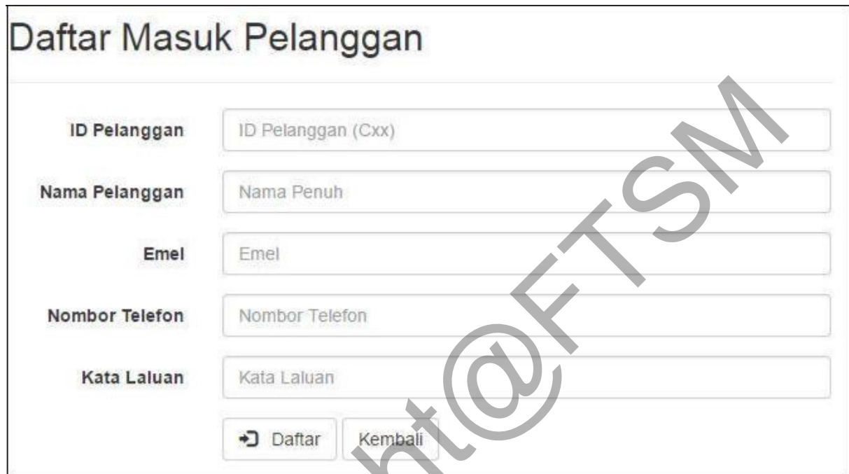
Rajah 2 Antaramuka Halaman Daftar Pelanggan

Rajah 2 merupakan halaman pendaftaran untuk pengguna. Pengguna yang ingin memohon sijil halal dikehendaki mendaftar dahulu. Pengguna dikehendaki memasukkan maklumat peribadi.