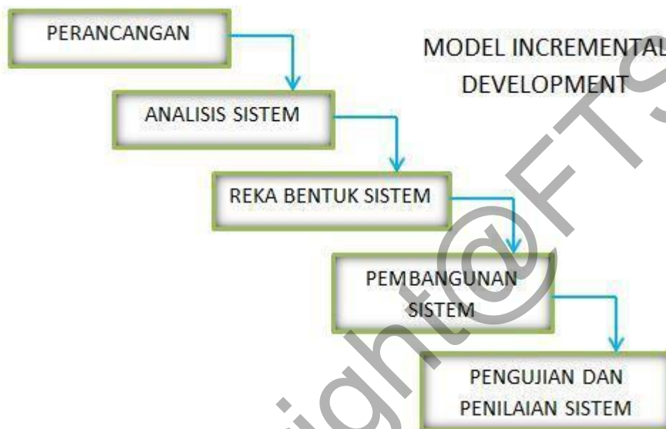
Rajah 1 Model Incremental Development

Pembangunan projek ini adalah berdasarkan kepada pembentukan fasa-fasa. Setiap fasa ini mempunyai perancangan kerja yang tertentu untuk membolehkan pembangunan projek ini dapat dijalankan dengan teratur, lancar dan terancang. Proses pembangunan Sistem Pemantauan Pensijilan Halal ini adalah berdasarkan Incremental Development iaitu ianya membenarkan pengulangan fasa. Pengulangan fasa adalah amat penting untuk projek ini supaya sistem yang dibangunkan ini betul-betul memenuhi keperluan pengguna.