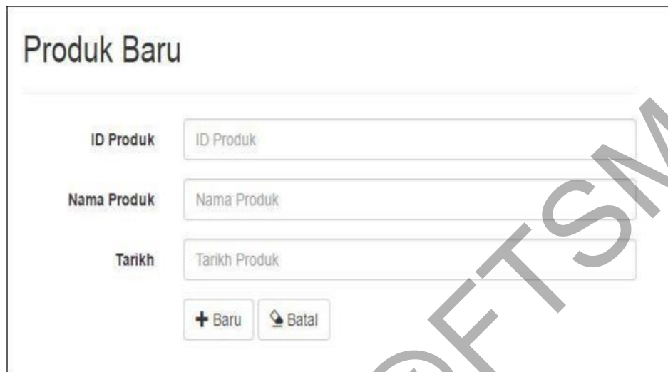
Rajah 5 Antaramuka Halaman Tambah Produk

Rajah 5 menunjukkan antaramuka halaman tambah produk dimana fungsi ini hanya boleh digunakan oleh pelanggan sahaja. Pelanggan boleh menambah produk baru jika mempunyai produk yang baru.