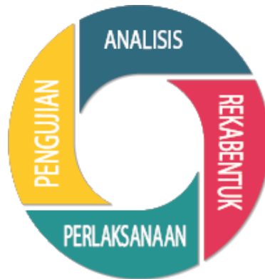
Rajah 2 Metodologi Agile

Fasa Pengujian merupakan fasa yang penting dalam metodologi ini. Hal ini kerana, ralat yang terdapat di dalam aplikasi CheckLine dapat dikenalpasti dan dibaiki dengan pantas disebabkan oleh pengujian yang berterusan pada setiap peringkat