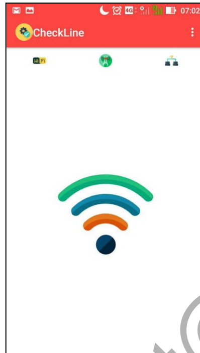
Rajah 3 Fragmen Antaramuka CheckLine Wi-Fi

dibangunkan di dalam aplikasi ini akan diuji bagi menentukan kelancaran fungsi tersebut. Rajah 3 dan Rajah 4 merupakan antaramuka CheckLine yang telah dibangunkan.