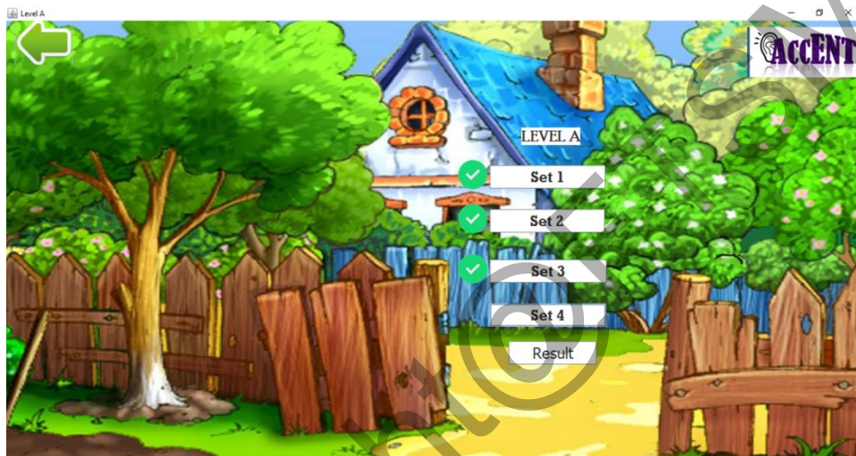
Rajah 4 Antara Muka Pemilihan Set Soalan

Pengguna perlu memilih set soalan dan memulakan ujian dengan memilih jawapan daripada matriks gambar berdasarkan ayat-ayat yang didengari. Rajah 4 menunjukkan pemilihan set soalan dan set yang telah disiapkan akan ditunjukkan dengan tick. Rajah 5 menunjukkan proses ujian. Patient perlu mendengar ayat yang dikeluarkan daripada video dan memilih matriks gambar yang sesuai. Setelah menyiapkan soalan 1, pengguna menekan butang Next untuk soalan seterusnya.