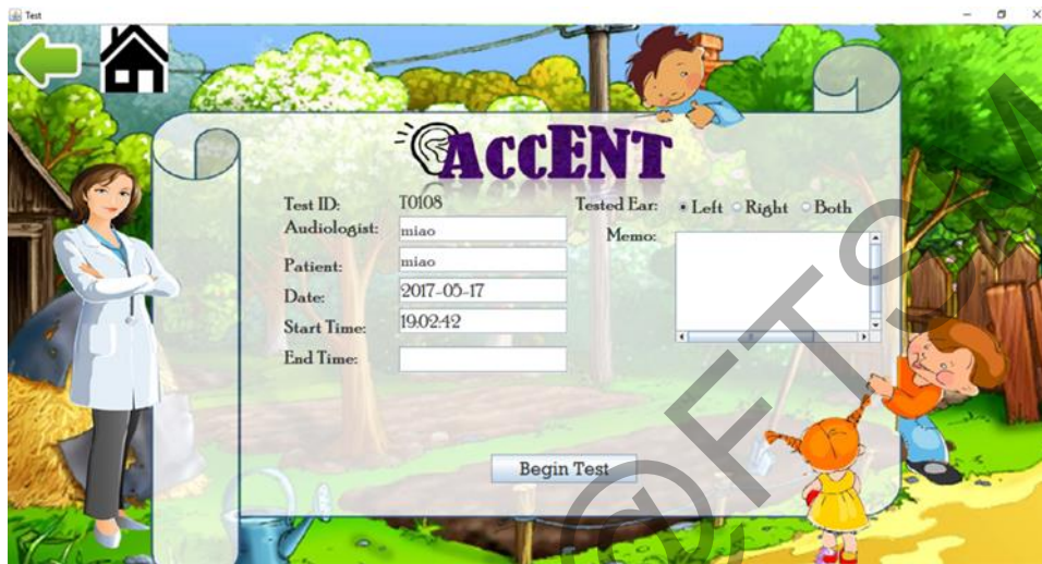
Rajah 1 Antara Muka Latihan

Pengguna perlu mendaftarkan sesi ujian sebelum menjalankan ujian. Audiologis perlu mengisi maklumat yang berkaitan dengan ujian tersebut dan mencatat nota jika perlu. Masa dan tarikh ujian sesi ujian akan direkod secara automatik mengikut masa komputer.