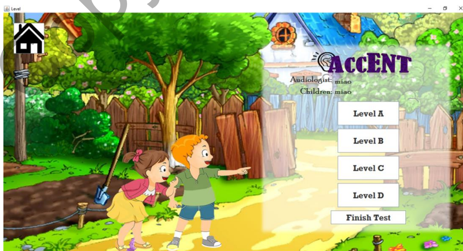
Rajah 2 Antara Muka Pemilihan Tahap Ujian ACCENT

Ujian ini mempunyai empat tahap iaitu Tahap A sehingga Tahap D. Setiap tahap mempunyai beberapa set soalan. Audiologis perlu memilih tahap yang hendak diuji mengikut prestasi patient.