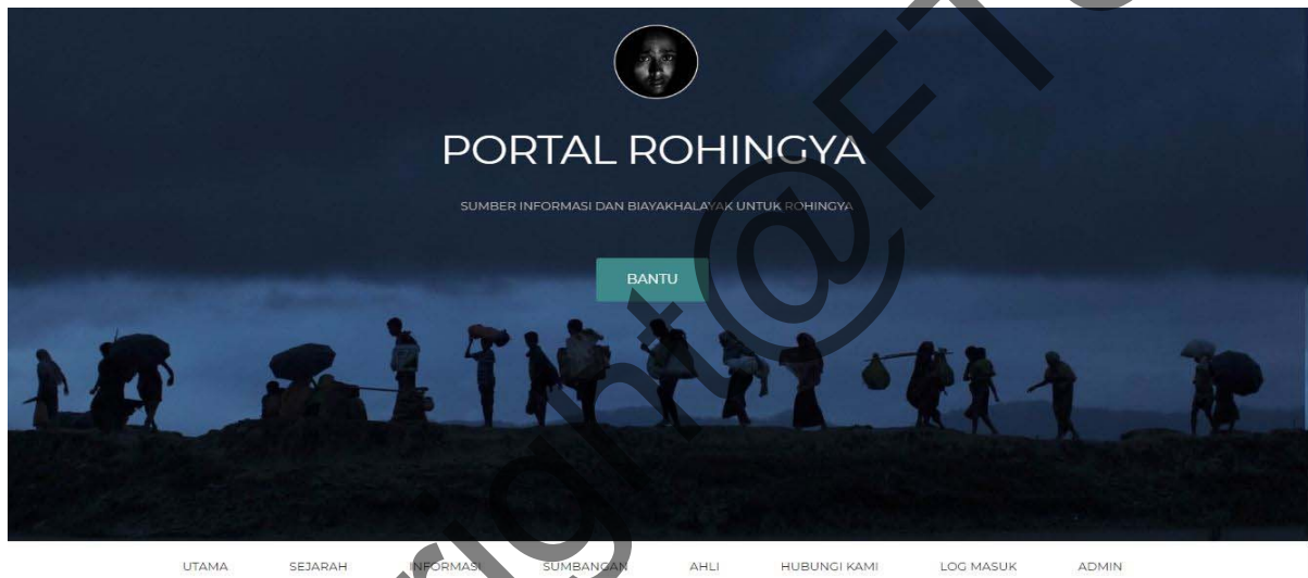
Rajah 2 Antara Muka Halaman portal bersama modul butang

Rajah 1 dan 2 menunjukkan antara muka bagi laman utama dimana ketiga-tiga pihak iaitu pengguna umum, pengguna berdaftar dan pentadbir akan melihat ketika membuka pautan portal ini. Laman utama menunjukkan tajuk portal yang menjadi fokus utama pembangunan portal ini dan kesemua butang seperti utama, sejarah, informasi, sumbangan, ahli, hubungi kami, log masuk dan admin akan terparap. Butang log masuk berfungsi untuk pengguna berdaftar dan pentadbir log masuk ke dalam portal dan pengguna baru yang ingin mendaftar sebagai pengguna berdaftar.