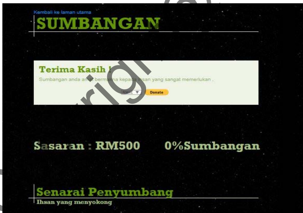
Rajah 8 Antara muka dalam modul Sumbang

Rajah 7 dan 8 menunjukkan antara muka bagi modul Sumbang Dana. Penggunaan kaedah biayakhalayak dalam portal ini memberikan pengguna untuk menderma dana tanpa rasa ragu-ragu kerana dapat mengetahui derma tersebut disalurkan kepada pihak yang berkenaan.