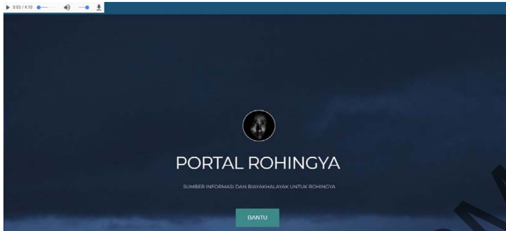
Rajah 1 antara muka halaman portal