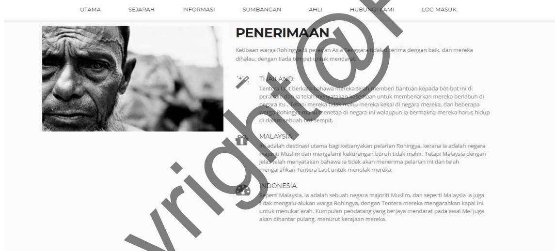
Rajah 4 Antara muka modul Sejarah bahagian fakta penerimaan