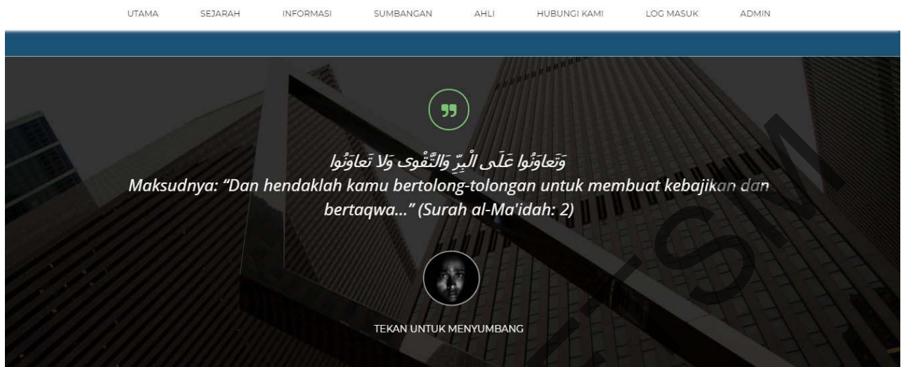
Rajah 7 Antara muka modul Sumbang

sub modul tambahan iaitu artikel dan video. Hanya pengguna berdaftar sahaja yang boleh mengakses modul ini untuk memuat turun bahan-bahan dari portal tersebut.