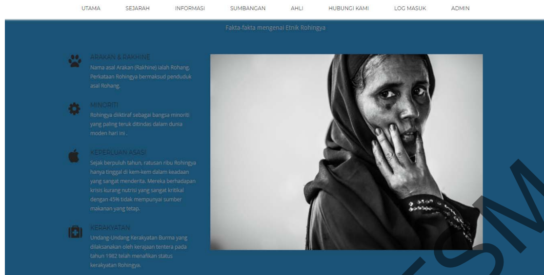
Rajah 3 Antara muka modul Sejarah Bahagian fakta