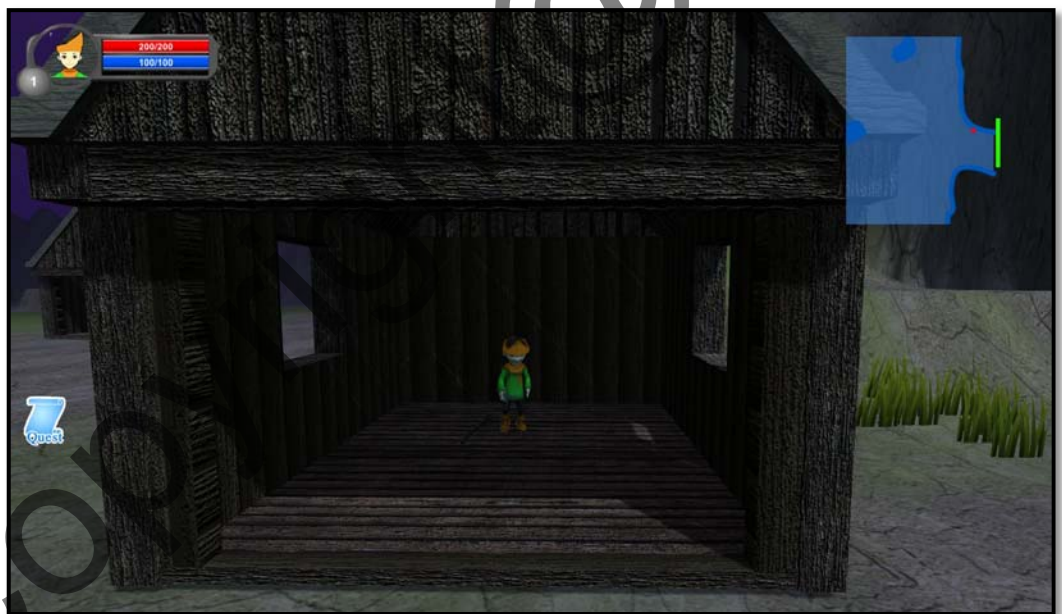
Rajah 1(c) Antara muka bagi misi permainan yang pertama untuk mencari Keris Taming Sari