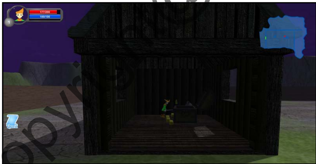
Rajah 1(g) Antara muka bagi misi permainan yang kedua untuk mendapatkan Mantra