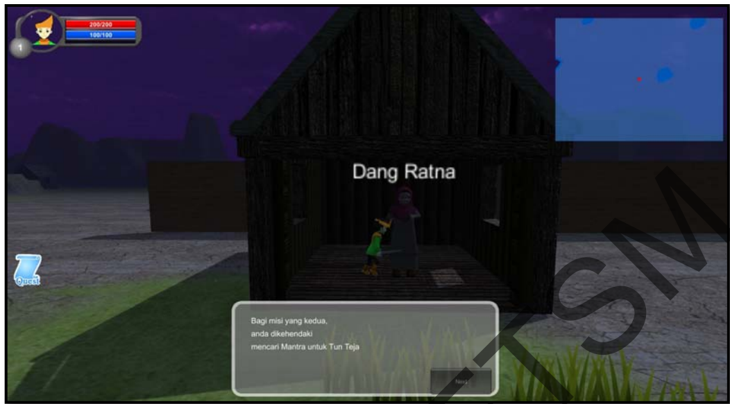
Rajah 1(f) Antara muka bagi misi permainan yang kedua untuk mencari Mantra