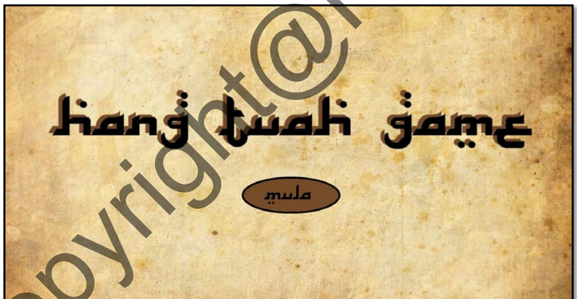
Rajah 1(a) Antara muka bagi menu utama permainan

Hasil kajian yang dijalankan oleh pembangun permainan Hang Tuah merupakan prototaip perisian permainan yang dibangunkan menggunakan kerangka konsep yang memberi penekanan kepada gabungan teknik penceritaan dalam permainan Hang Tuah. Rentetan itu pengujian dijalankan kepada pengguna sasaran untuk melihat keberkesanan perisian dari aspek keboleh bermain (jalan cerita, matlamat jelas), kepenggunaan (antara muka), dan keberkesanan permainan yang dibangunkan. Proses reka bentuk antara muka menu utama permainan, antara muka paparan permainan Hang Tuah dan antara muka paparan tamat permainan. Rajah 1(a) dan Rajah 1(h) merupakan reka bentuk antara muka menu utama permainan, antara muka paparan permainan dan paparan tamat permainan Hang Tuah.