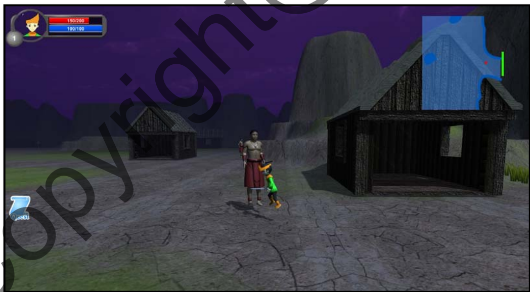
Rajah 1(e) Antara muka bagi cabaran permainan Hang Tuah untuk berlawan dengan pahlawan Majapahit