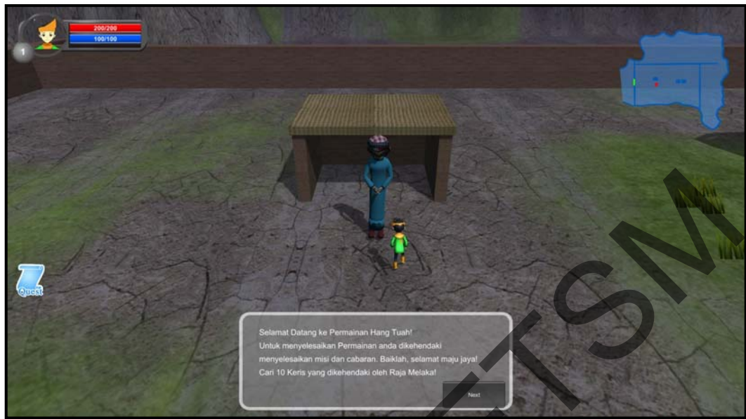
Rajah 1(b) Antara muka bagi cabaran permainan yang pertama