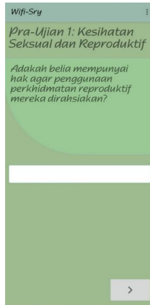
Rajah 7: Antara Muka untuk salah satu soal selidik

firebaseFirestore.collection( collectionPath: "SoalSelidik").document(ss).get().addOnCompleteListener(new OnCompleteListener<DocumentSnapshot>() { @Override public void onComplete(@NonNull Task<DocumentSnapshot> task) { if(task.isSuccessful()) { DocumentSnapshot documentSnapshot = task.getResult(); if(documentSnapshot.exists() && documentSnapshot != null) { txtTitle.setText(documentSnapshot.getString( field: "ssTajuk")); } } else { Log.d(FIRE_LOG, msg: "Error: " + task.getException().getMessage()); } } });