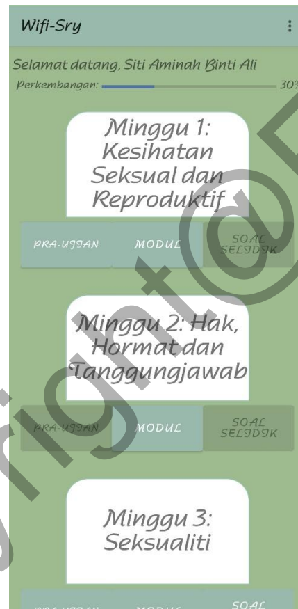
Rajah 4: Antara Muka Laman Utama

Laman utama diberi akses kepada pengguna yang berjaya log masuk. Laman utama akan memaparkan nama penuh dan perkembangan pengguna dengan mendapatkan akses daripada Firebase . Senarai modul daripada Firestore disenaraikan menggunakan RecyclerView . Intent digunakan untuk membawa ID modul atau soal selidik ke halaman yang dipilih. Rajah 5.4 menggambarkan antara muka untuk laman utama dan Rajah 5.5 dan Rajah 5.6 menunjukkan segmen kod untuk laman utama.