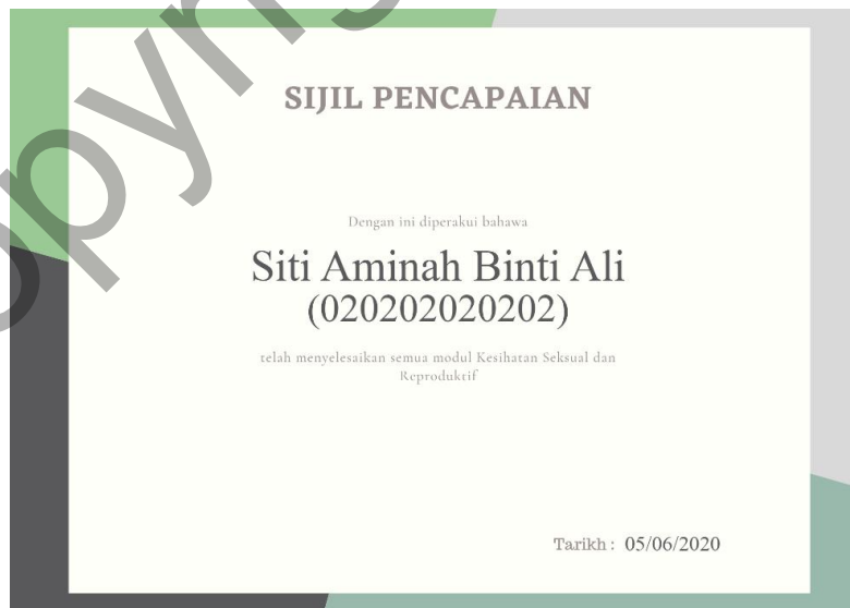
Rajah 11: Contoh E-Sijil Dihasil