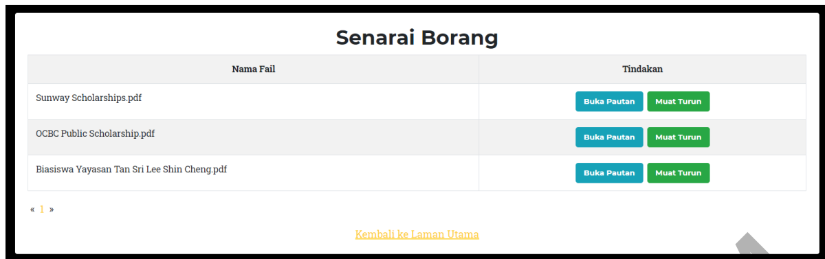
Rajah 9 Antara muka muat turun borang