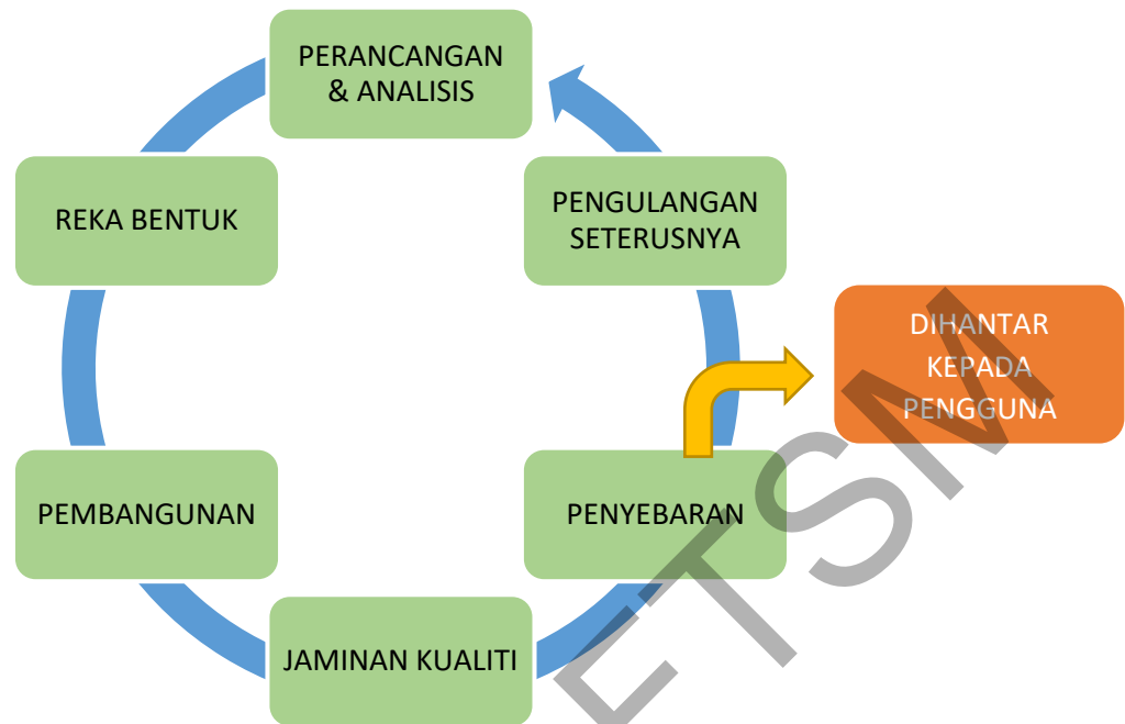
Rajah 1: Pembangunan Metodologi Agile