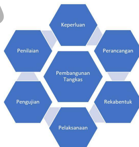
Rajah 1 Teknik Pembangunan Tangkas

Bagi memastikan semua keperluan perisian dapat disempurnakan dalam jangka masa yang ditetapkan, pembangunan sistem ini akan dibahagikan kepada beberapa fasa. Pembahagian beberapa fasa ini akan membenarkan pihak berkepentingan untuk terlibat dan memberi sebarang maklum balas mengenai penghasilan sistem secara langsung (Charles, 2015). Rajah 1.1 memaparkan model pembangunan tangkas yang digunakan dalam membangunkan sistem ini.