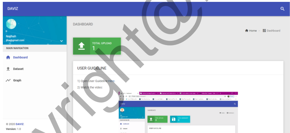
Rajah 2 Laman utama Pengguna Umum

Projek pembangunan Sistem Pemrosesan Data Deskriptif sebagai SaaS ini secara keseluruhannya telah berjaya dibangunkan mengikut spesifikasi yang ditetapkan dan mencapai objektif utama untuk membangunkan sebuah enjin pemrosesan data deskripsi menggunakan bahasa pengaturcaraan Python dan menyediakan pelantar perisian menggunakan AWS. Rajah 2 dan Rajah 3 menunjukkan antaramuka bagi dua pengguna sistem iaitu pengguna umum dan admin.