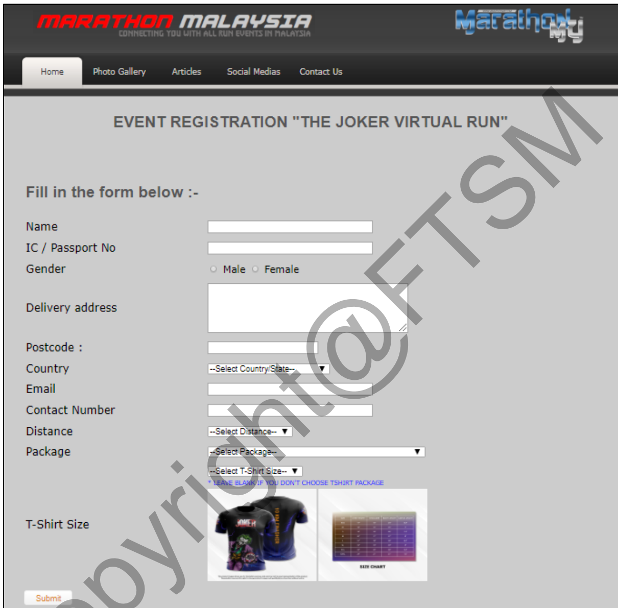
Rajah 5.7 : Antara muka pendaftaran acara