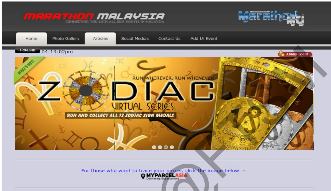
Rajah 5.1 : Antara muka laman utama