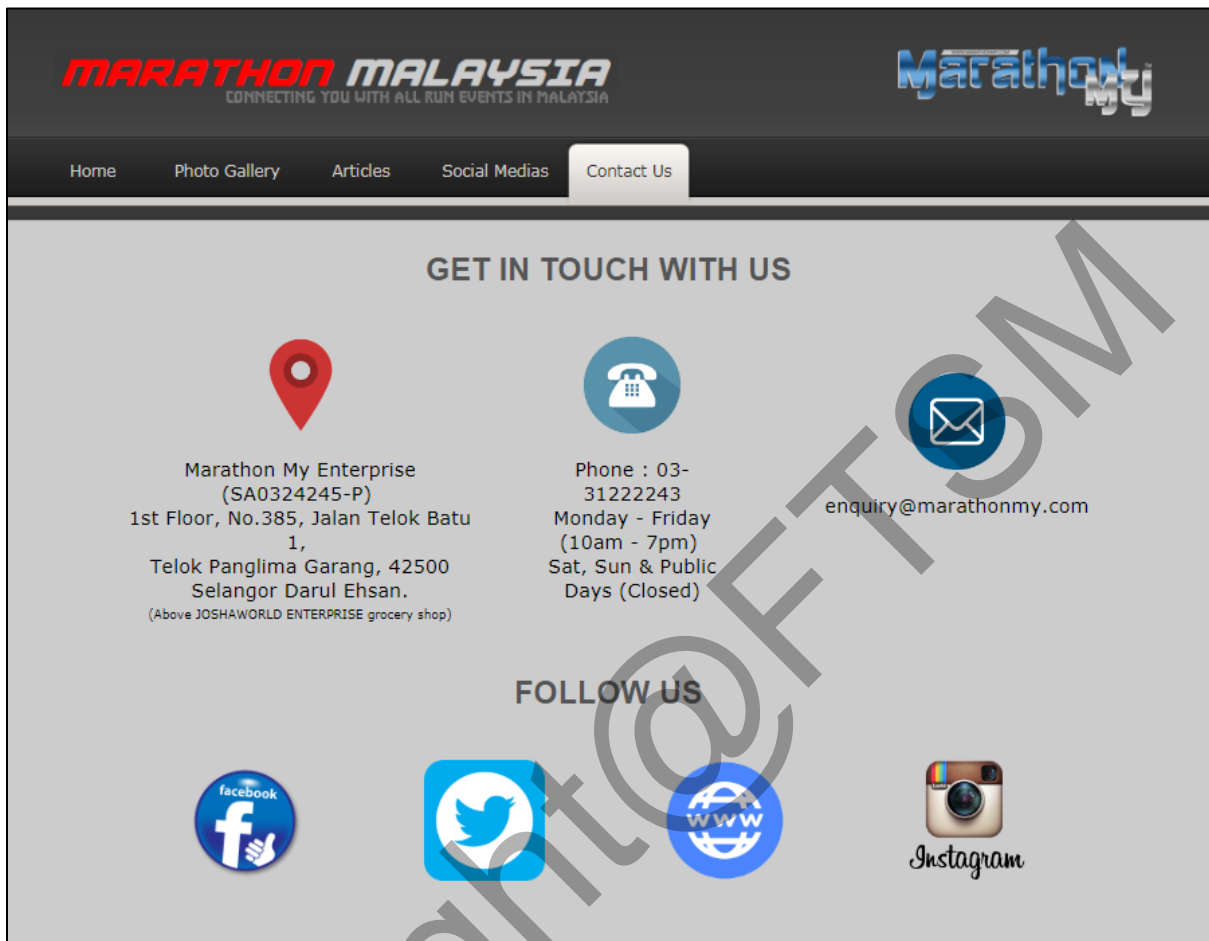
Rajah 5.16 : Antara muka hubungi kami