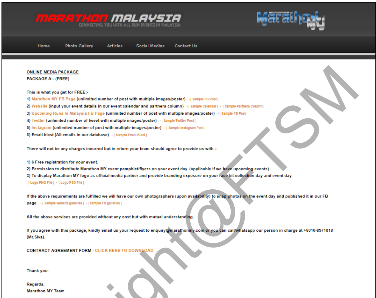
Rajah 5.12 : Antara muka talian media pakej