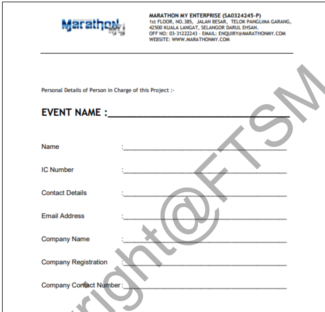
Rajah 5.13 : Antara muka borang “customer contract agreement”