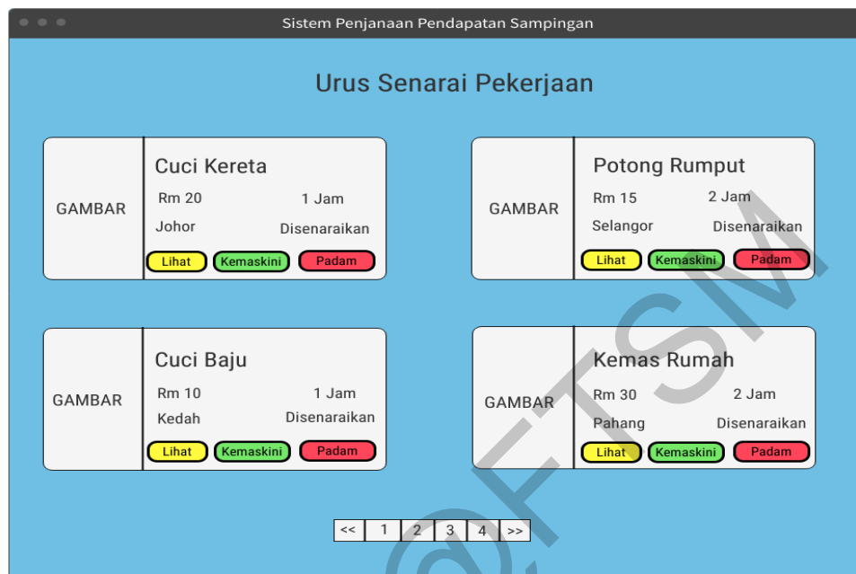
Rajah 9 Antara muka senarai pekerjaan

Antara muka senarai pekerjaan memaparkan senarai pekerjaan yang telah disenaraikan oleh majikan. Rajah 9 menunjukkan antara muka senarai pekerjaan.