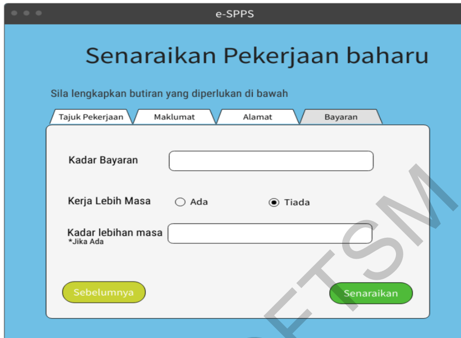
Rajah 13 Antara muka bahagian akhir tambah pekerjaan

Antara muka bayar gaji membenarkan majikan untuk melakukan pembayaran gaji kepada pelajar bagi pekerjaan yang telah lengkap dan selesai. Rajah 14 menunjukkan antara muka bayar gaji bagi sistem ini.