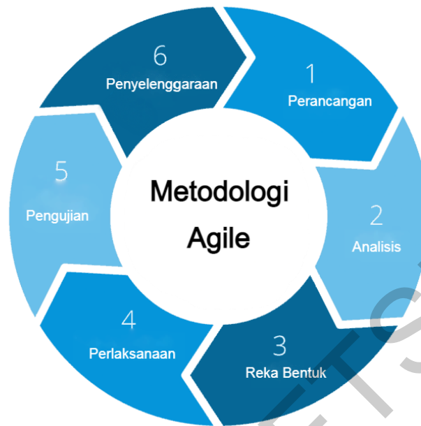
Rajah 1 Fasa dalam metodologi agile