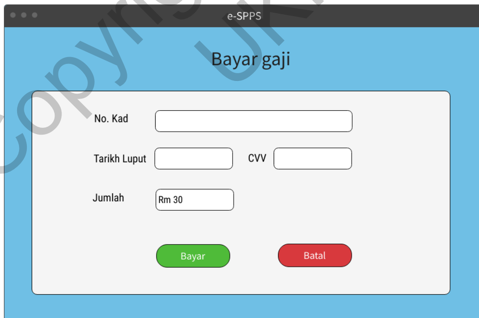
Rajah 14 Antara muka bayar gaji

Antara muka bayar gaji membenarkan majikan untuk melakukan pembayaran gaji kepada pelajar bagi pekerjaan yang telah lengkap dan selesai. Rajah 14 menunjukkan antara muka bayar gaji bagi sistem ini.