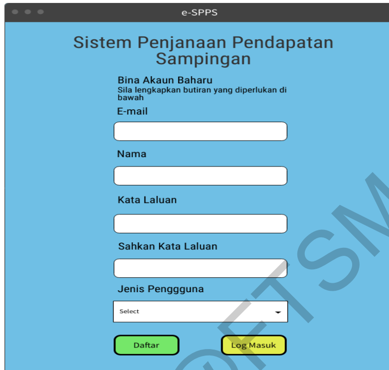
Rajah 2 Antara muka daftar akaun

Rajah 3 menunjukkan antara muka log masuk akaun bagi pengguna sedia ada yang telah mendaftarkan diri untuk menggunakan sistem ini. Pengguna sedia ada hanya perlu mengisi butiran yang diperlukan seperti Email dan Kata laluan yang telah digunakan semasa pendaftaran akaun.