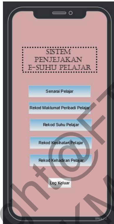
Rajah 4.22 Reka Bentuk Antara Muka Halaman Utama

Rajah di bawah menunjukkan antara muka halaman utama bagi Aplikasi Penjejakan Suhu Pelajar. Setelah log masuk, guru dikehendaki memilih ruangan yang ingin dilihat.