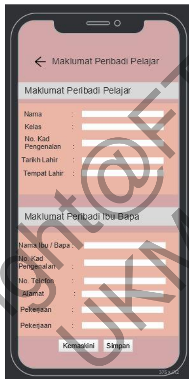
Rajah 4.24 Reka Bentuk Antara Muka Maklumat Peribadi Pelajar

Rajah di bawah menunjukkan antara muka menetapkan dan mengemaskini Maklumat Peribadi Pelajar dan maklumat ibu bapa pelajar. Guru yang ingin menyimpan maklumat peribadi pelajar untuk dijadikan rujukan dan simpanan perlu membuat penetapan profil pelajar dengan memasukkan maklumat pelajar di dalam aplikasi.