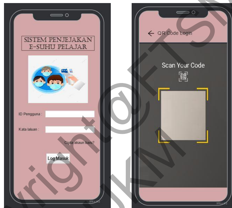
Rajah 4.21 Reka Bentuk Antara Muka Muka Pendaftaran

Rajah di bawah menunjukkan antara muka pendaftaran. Guru yang ingin menggunakan Aplikasi Penjejakan Suhu Pelajar perlu mendaftar sebagai pengguna. Guru yang telah mendaftar perlu log masuk ke dalam aplikasi dengan memasukkan ID Pengguna dan kata laluan. Pendaftaran bagi pelajar adalah berdasarkan pengimbasan Kod QR yang telah dikhususkan bagi setiap pelajar.