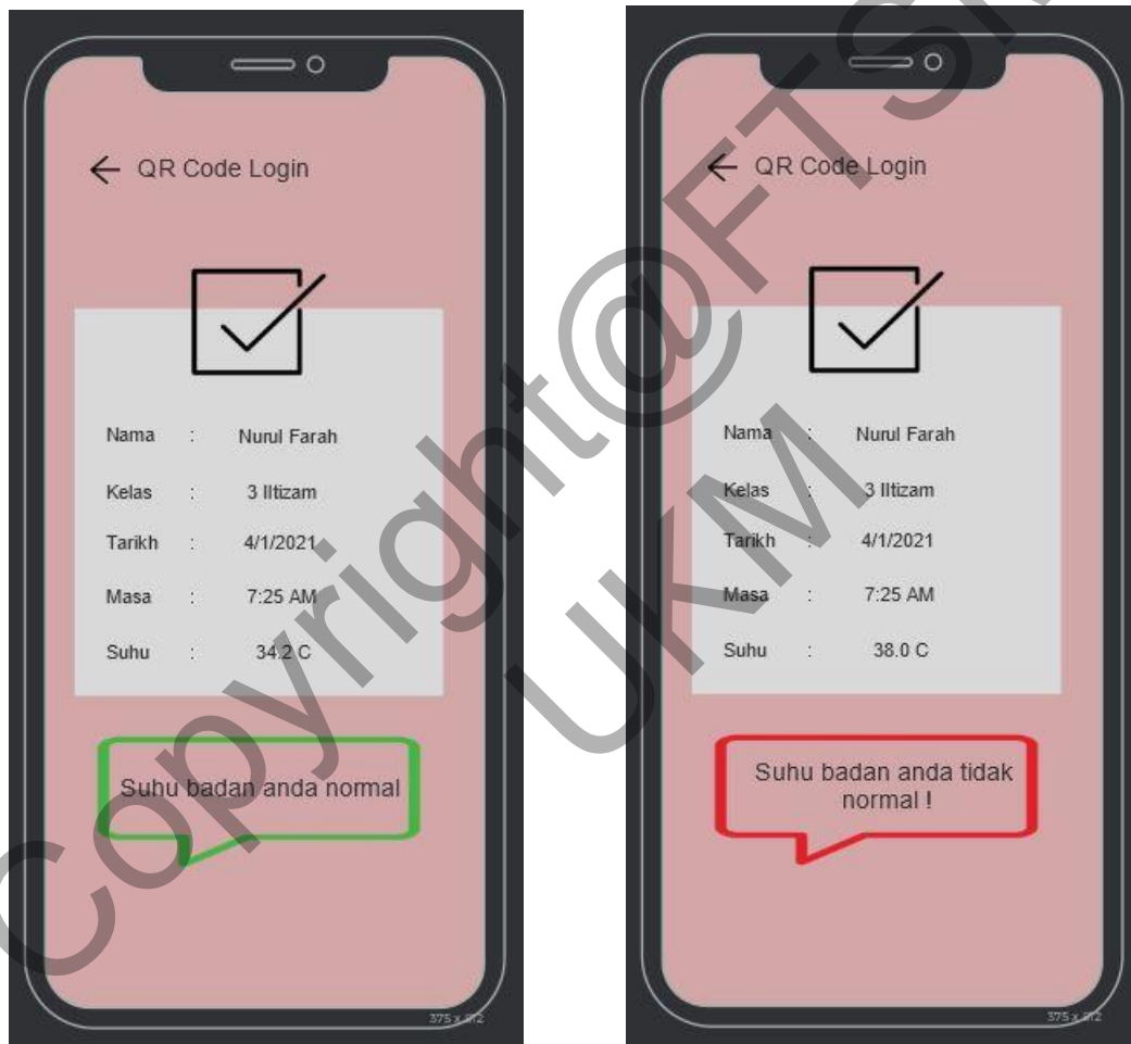
Rajah 4.28 Reka Bentuk Antara Muka Keputusan Suhu Pelajar

Rajah di bawah menunjukkan antara muka aplikasi ketika membuat paparan keputusan suhu selepas pelajar mengambil suhu. Keputusan suhu normal akan dipaparkan beserta dengan nama, kelas, tarikh dan masa pelajar mengambil suhu jika suhu pelajar berada dalam tahap yang normal. Amaran keputusan suhu tidak normal akan dipaparkan beserta dengan nama, kelas, tarikh dan masa pelajar mengambil suhu jika suhu pelajar berada dalam tahap tidak normal atau melebihi tahap yang normal.