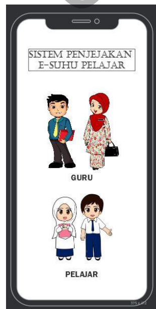
Rajah 4.20 Reka Bentuk Antara Muka Log Masuk

Rajah di bawah menunjukkan antara muka log masuk. Guru yang telah mendaftar perlu log masuk ke dalam aplikasi laluan untuk menyimpan maklumat dan menyimpan rekod pelajar.