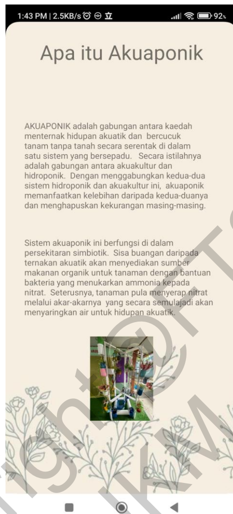
Rajah 3 Antara Muka Info Akuaponik

Bagi Modul yang terakhir, iaitu Modul Permainan Susun Suai Gambar, pengguna boleh menekan tahap kesukaran yang ingin dimainkan dan seterusnya permainan susun suai gambar akan dipaparkan. Rajah 4 dan 5 menunjukkan antara muka bagi Modul Permainan Susun Suai Gambar.