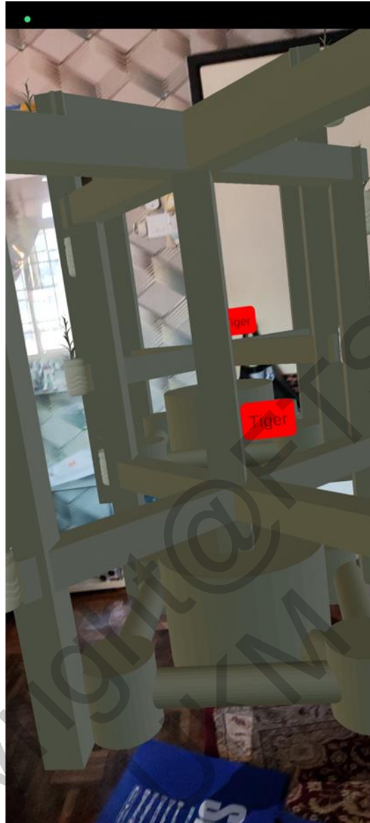
Rajah 2 Antara Muka Modul AR

Seterusnya, pengguna boleh menekan butang info akuaponik untuk memaparkan jenis-jenis info. Selepas itu, pengguna boleh menekan info yang ingin dibaca. Rajah 3 menunjukkan antara muka info akuaponik.