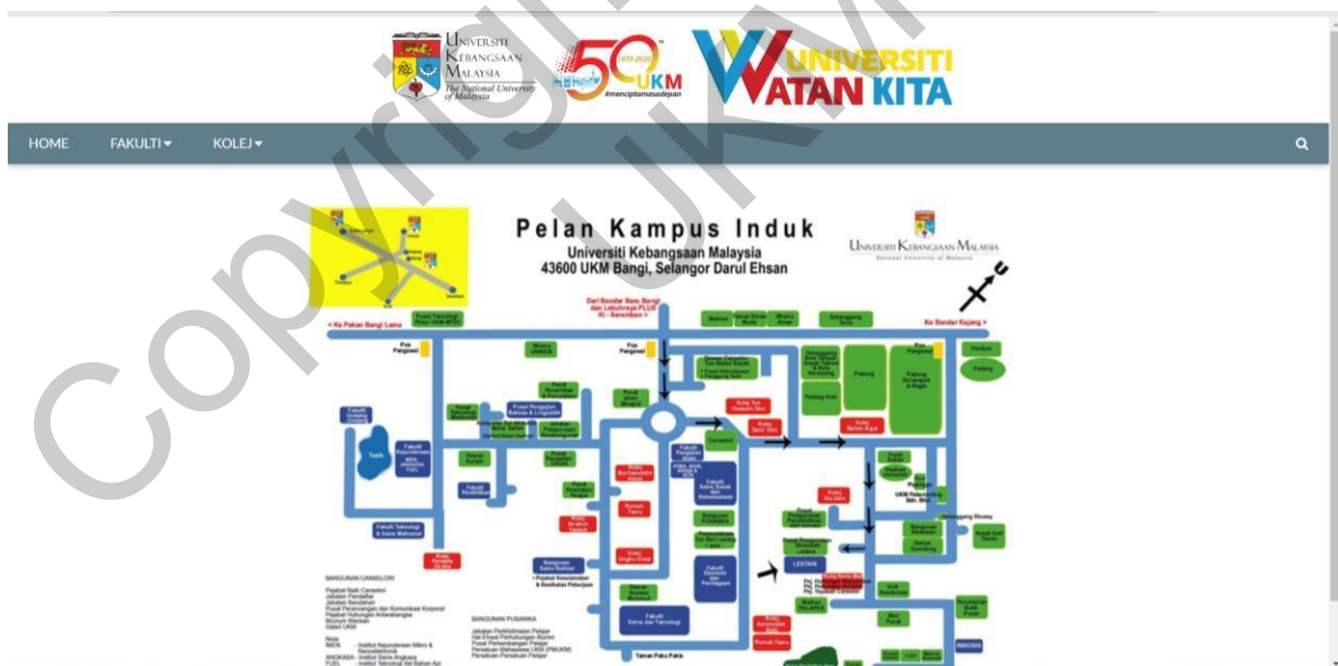
Rajah 4 Antara muka laman utama sistem

Staf PTM yang berdaftar akan dibawa ke antara muka bagi utama bagi sistem pemerhatian isyarat WIFI. Rajah 4 menunjukkan antara muka laman utama bagi sistem pemerhatian isyarat WIFI.