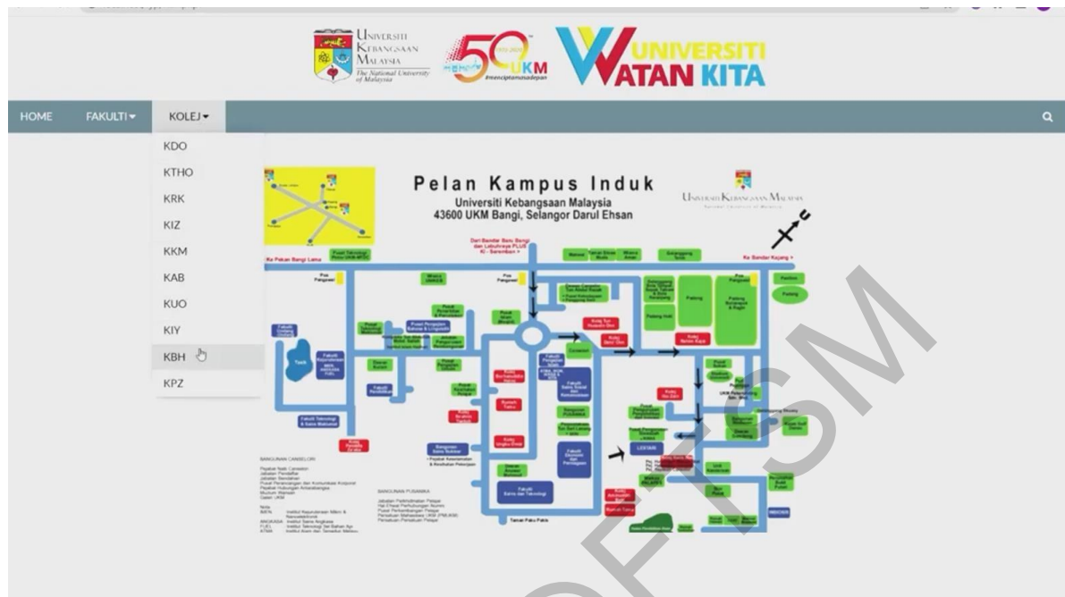
Rajah 5 Antara muka bagi pilihan kawasan di dalam UKM

Sistem pemerhatian isyarat WIFI di persekitaran UKM menunjukkan status bacaan AP yang akan dikeluarkan melalui AP kepada pengkalan data dan kemudian dihantar ke dalam sistem pemerhatian ini. Rajah 6 menunjukkan jadual bagi bacaan AP yang telah dibaca oleh perkakas internet benda iaitu RP pada AP 1 yang terdapat di dalam persekitaran UKM iaitu di Kolej Burhanuddin Helmi.