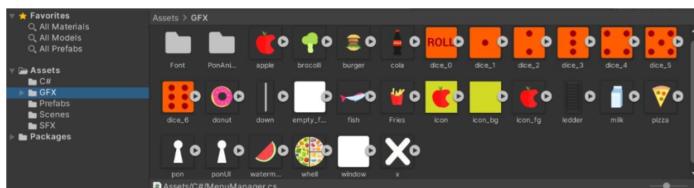
Rajah 5.3 Model dan Elemen 2D