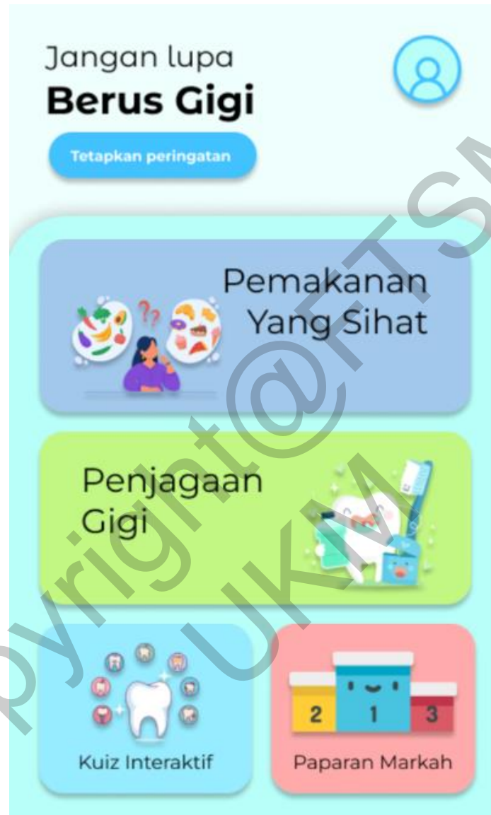
Rajah 3 Antara muka halaman utama aplikasi Jom Dentist

Pengguna akan dibawa ke halaman utama aplikasi Jom Dentist. Pengguna perlu klik pada butang yang terdapat pada halaman utama untuk menggunakan fungsi-fungsi yang tersedia dalam aplikasi tersebut. Rajah 3 menunjukkan antara muka menu utama aplikasi Jom Dentist.