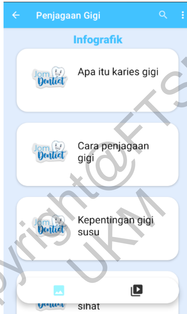
Rajah 5 Antara muka penjagaan gigi

Jika pengguna klik pada butang “Penjagaan Gigi”, aplikasi akan memaparkan kepada pengguna senarai kandungan penjagaan gigi berbentuk infografik dan juga video. Rajah 5 menunjukkan antara muka penjagaan gigi.