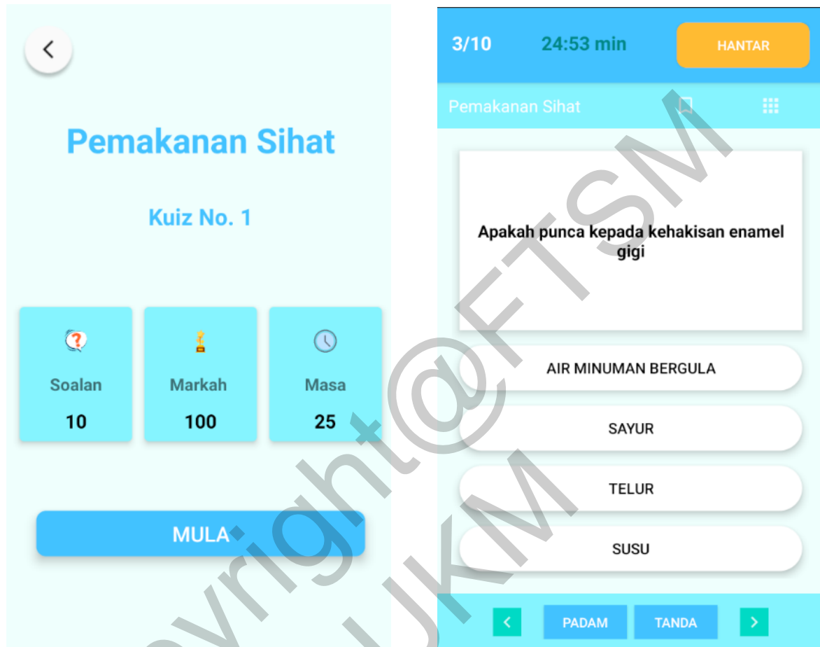
Rajah 6 Antara muka kuiz interaktif

Jika pengguna klik pada butang “Kuiz Interaktif”, aplikasi akan memaparkan senarai kuiz yang tersedia di dalam aplikasi Jom Dentist. Rajah 6 menunjukkan antara muka kuiz interaktif Jom Dentist.