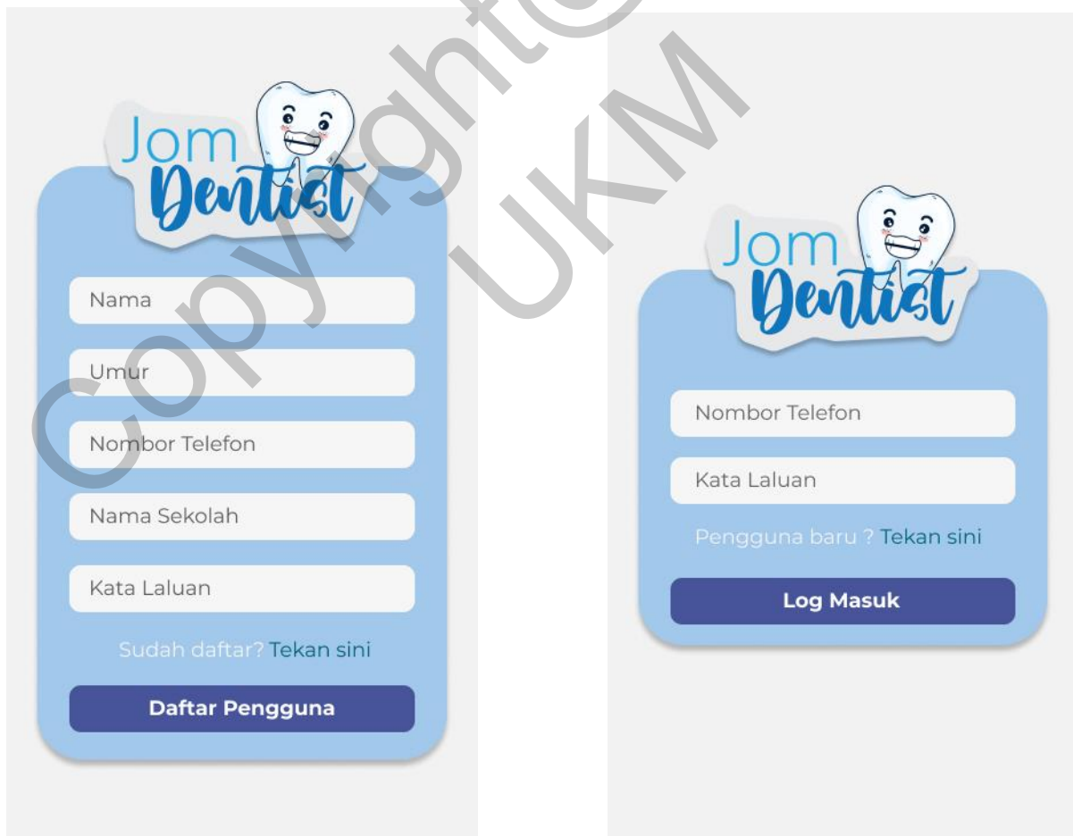
Rajah 2 Antara muka log masuk dan daftar pengguna

Pengguna pelajar sekolah rendah perlu memasukkan email dan kata laluan terlebih dahulu untuk log masuk ke dalam aplikasi. Jika tidak berdaftar, pengguna boleh tekan link daftar sini untuk membuat pendaftaran. Pengguna perlu mengisi kesemua ruangan pendaftaran bagi mendapat status berdaftar. Rajah 2 menunjukkan antara muka log masuk dan daftar pengguna.